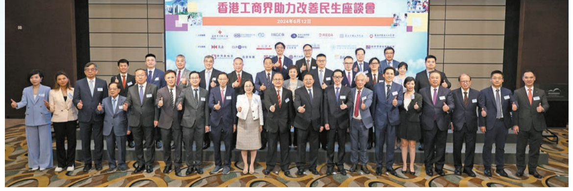
「香港工商界助力改善民生座談會2024」昨於香港會議展覽中心舉行。

【香港商報訊】記者康鈞森、李銘欣報導：由香港中華總商會聯同香港中華廠商聯合會、香港總商會、香港工業總會、香港地產建設商會、香港中國企業協會及香港中華出入口商會，聯合舉辦的「香港工商界助力改善民生座談會2024」昨日於香港會議展覽中心舉行。中聯辦副主任尹宗華出席，本港多家企業和中資機構代表蒞臨與各商會領導分享工商界在助力民生發展的工作成果，並展望工商界如何進一步推動業界落實更多改善民生的相關工作，共建和諧友愛社會，全力貫徹落實主席提出「切實排解民生憂難」的囑咐。