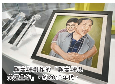
顧嘉輝創作的「顧嘉輝與黃霑畫作」，約2010年代。