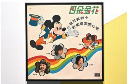
四朵金花《世界真細小》黑膠唱片封套，1975年。

手筆，展品包括多張珍貴的唱片封套，如收錄了由黃霑填詞、其音樂創作好拍檔顧嘉輝作曲、港人耳熟能詳的《獅子山下》；由霑叔為經典兒歌填上粵語歌詞的《世界真細小》等。同樣是「輝黃」組合作品的《上海灘》電視劇主題曲歌詞手稿由霑叔家人借出。陳館長介紹，這首家喻戶曉的歌曲是兩人透過電話溝通合作：「黃霑創作《上海灘》時非常倉促，在電話中，顧嘉輝哼音樂，黃霑筆錄填詞，再唱給顧嘉輝聽。霑叔曾提過寫歌時填了開首的『浪奔、浪流』後花了二十分鐘就填好全首詞，事後他說自己從未去過黃浦江，『浪奔、浪流』是他自己的想像，反映了他的文筆、中文造詣之高。」陳館長提醒，展覽展示的為複製品，原稿在博物館另一展覽「眺潮香港60+」中展出。