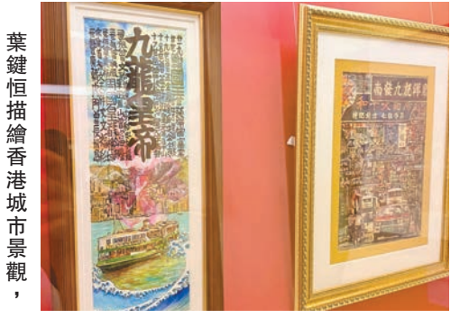
葉鍵恒描繪香港城市景觀，容易令觀者產生共鳴。

葉鍵恒畢業於英國伯明翰城市大學產品設計學系，作品以水彩描繪香港的街景和人文風情。他巧妙融合香港城市文化元素，畫作色彩豐富，畫面充滿活力與動感，盡顯香港的繁華與多樣性。他的作品