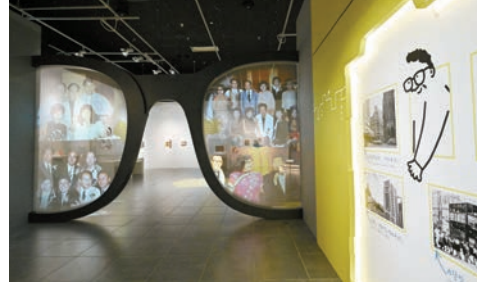
展廳入口處展示大型的黑框眼鏡，並播放黃霑生活照片，讓觀者深入認識一代才子。