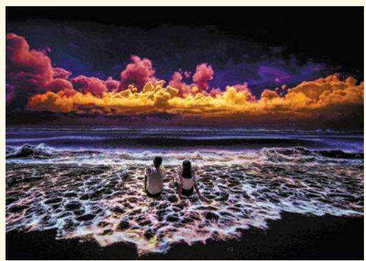
BEACH CLOUD 展區以夢幻海灘為主題，展示了新作《雲·彩》。

日期：即日起至另行通知 時間：周一至周五上午11時至晚上7時；周六、日及公眾假期上午10時至晚上7時 地點：鯉魚涌K11 Atelier King's Road HACC 2樓 票價：HK$108（平日）、HK$118（周末及假日） 內容：近年沉浸式光影展甚為流行，讓觀者通過光影藝術融入展品之中，帶來有別於傳統美術展覽的體驗。韓國沉浸式數碼藝術美術館即日起推出全新主題展覽「Eternal Nature」。展覽運用高科技數碼藝術，將四季、晝夜、雲、海、花、林等自然景象轉化為超現實的觀展過程，從紫藤花海到神秘森林，再到夢幻海灘和智慧巨鯨。其中《牡丹圖》、《雲·彩》為香港首展，在參觀、拍照同時欣賞自然之美。配合來自韓國調香師特製的香氣，為觀眾呈上多感官的豐富層次藝術體驗。