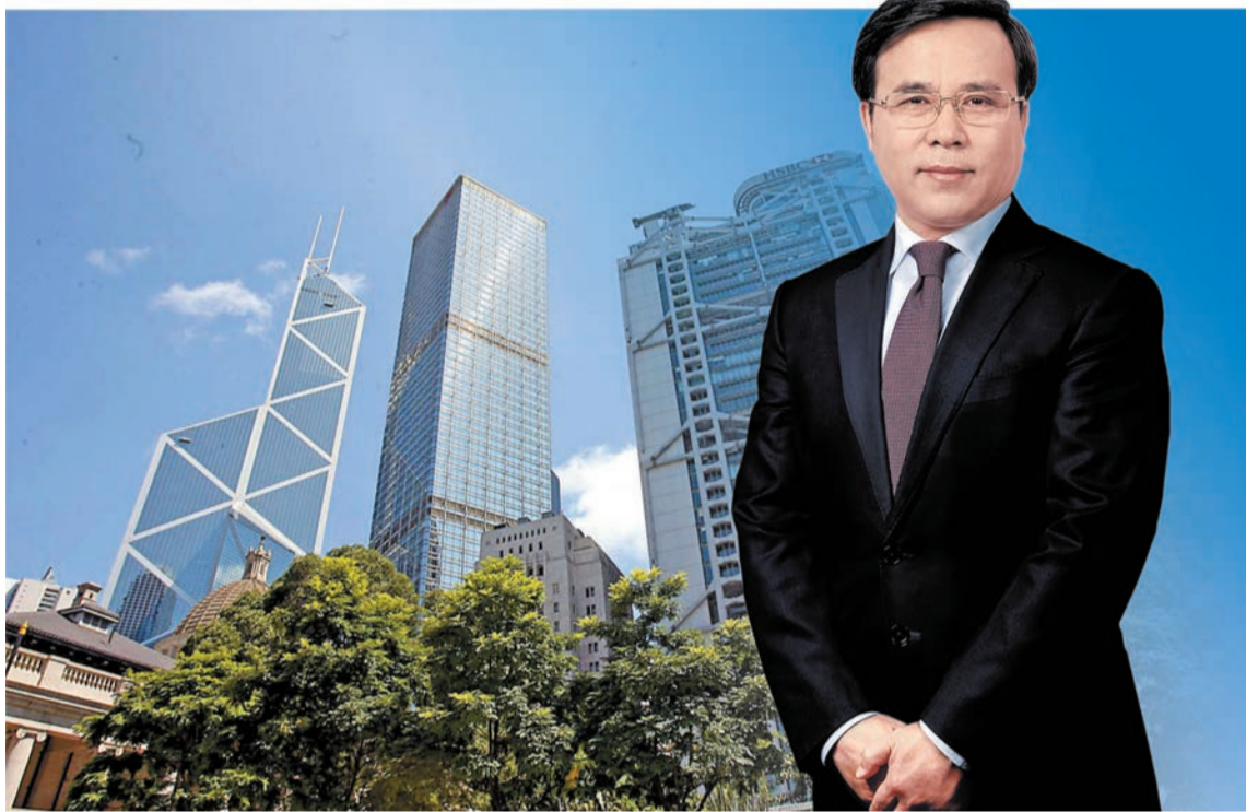
劉連舸相信，在新一屆特區政府領導下，香港經濟社會發展將開啟新篇章。