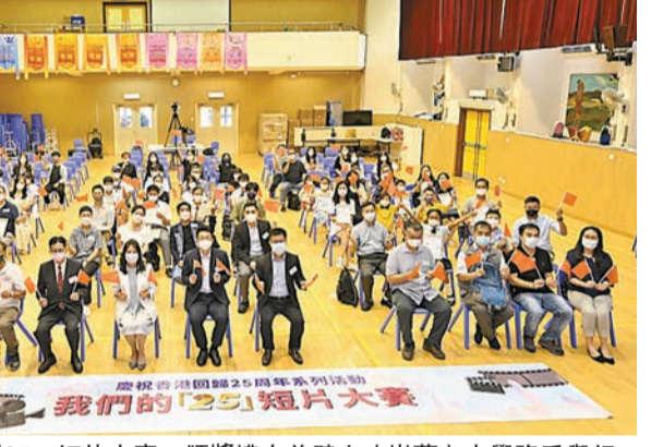
「我們的『25』短片大賽」頒獎禮在曾璧山(崇蘭)中學隆重舉行。

香港深圳社團總會會長鄧清河透過線上致辭，他表示，今次短片大賽以「25」為主題，具有特殊意義，香港回歸祖國25年來，祖國始終是香港堅強的後盾，認為未來在粵港澳大灣區的發展規劃下，香港機遇無限。他呼籲青年朋友們扎根香港，放眼未來，努力實現夢想。他指出，香港深圳社團總會未來將繼續舉辦更多面向青少年群體的活動，希望能有更多學校、團體一齊參與，共同為青少年發展出一分力。