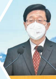
李家超重申粵港合作能帶來極大利益，感謝廣東對香港的大力支持。

【香港商報訊】記者李銘欣報導：昨日，行政長官李家超與廣東及廣州、深圳領導進行線上會議時提出「逆向隔離」方案，即讓香港赴內地人員先在香港隔離，再以閉環方式前往內地，以符合內地「7+3」入境檢疫政策，最終粵港雙方同意成立專班商議細節，並以電話和視像會議進行溝通。當天線上會議亦就強化粵港、穗港和深港合作機制達成多項共識。