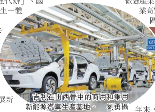
吉利在山西晉中的商用和乘用新能源汽車生產基地。

山西是國家資源型經濟轉型綜合配套改革試驗區。十年來，全省以轉型綜合試驗為引領，深化改革開放，優化營商環境，帶動興起了創新創業熱潮。 發展活力持續增強，打造了戰新產業市場化電價機制、「承諾制+標準地+全代辦」、國企提質增效、縣域醫療衛生一體化等一批改革「樣本」。 發展動能持續轉換，僅去年以來，就落戶高新技術企業365家，新增國家重點實驗室等國家級科創平台3家，引進高端領軍人才和博士研究生逾1400人，「手撕鋼」「碳纖維」「超級計算」等打開了發展新「藍海」。