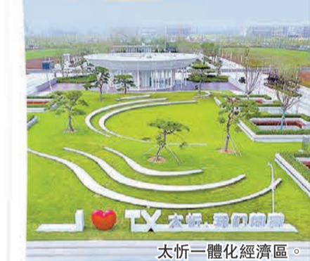
太忻一體化經濟區。