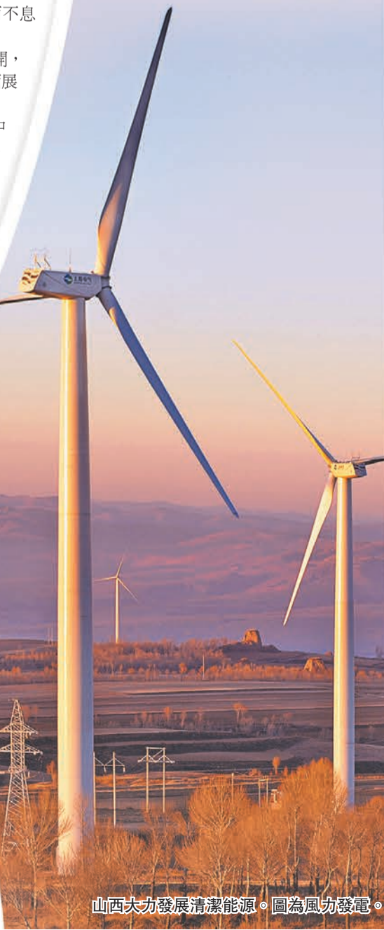
山西大力發展清潔能源。圖為風力發電。