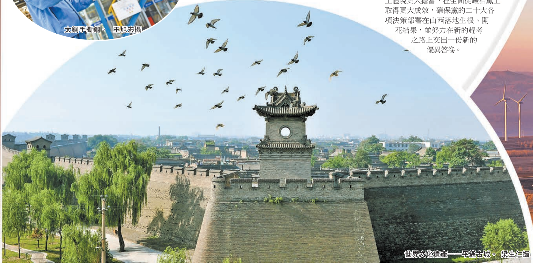
世界文化遺產——平遙古城。