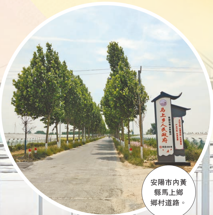
安陽市內黃縣馬上鄉鄉村道路。