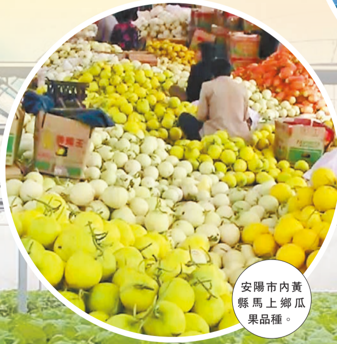
安陽市內黃縣馬上鄉瓜果品種。