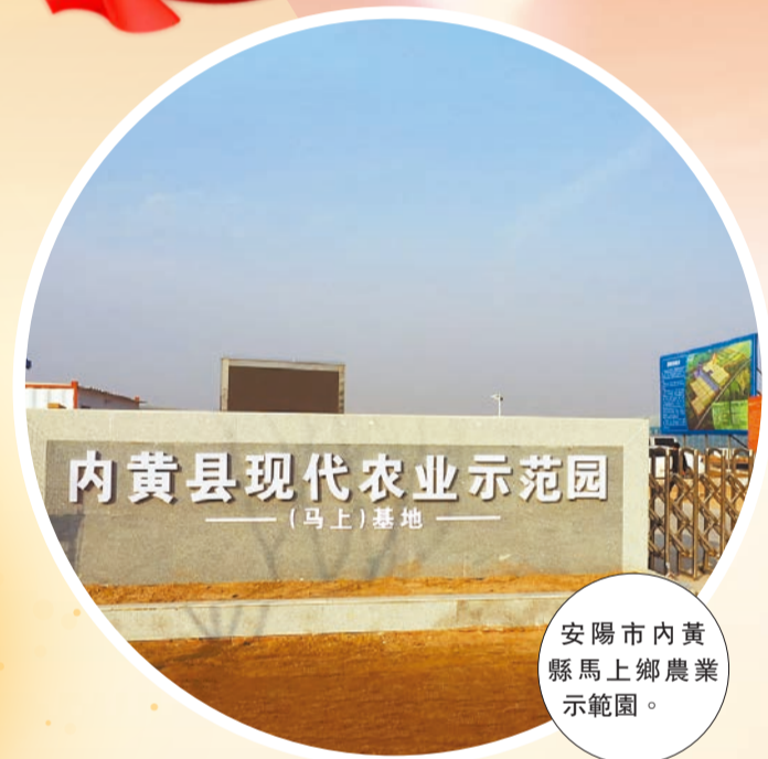
安陽市內黃縣馬上鄉農業示範園。