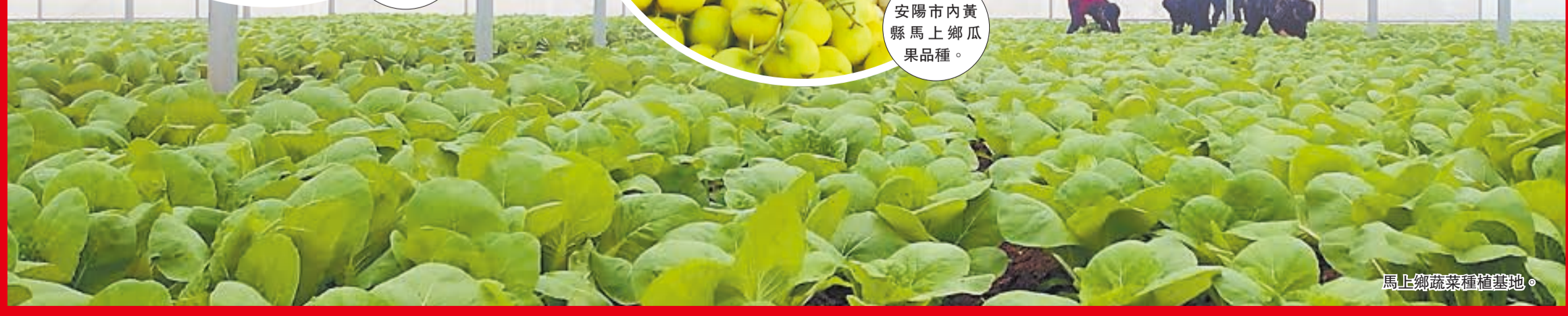
馬上鄉蔬菜種植基地。