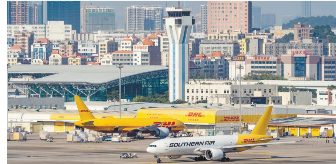
今年前11個月，深圳機場國際及地區貨量同比增長21.1%。

內、多哈、紐約、萊比錫、班加羅爾、利雅得等6條國際貨運航線，加密了洛杉磯、胡志明、大阪、首爾、河內、吉隆坡、伊斯坦布爾、萊比錫、克拉克、曼谷10條國際貨運航線，國際及地區貨運通航點達35個，通達全球23個國家和地區，國內外貨運航線通航點增加至57個。