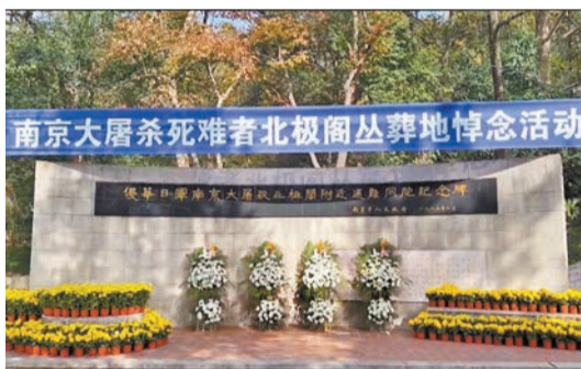
12月13日，南京各界人士在南京大屠殺北極閣叢葬地舉行悼念活動。

蔡奇講話後，85名南京市青少年代表宣讀《和平宣言》，6名社會各界代表撞響「和平大鐘」。伴隨着3聲深沉的鐘聲，3000隻和平鴿展翅高飛，寄託着對死難者的無盡哀思和對世界和平的無限期許。