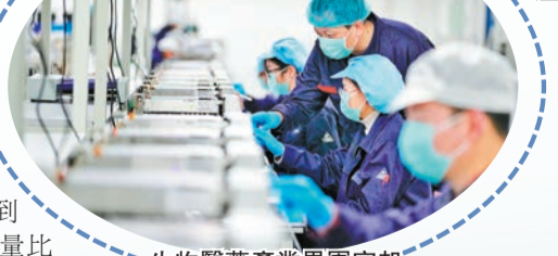
生物醫藥產業異軍突起

根據《規劃》，在大數據智能化產業方面，大渡口區強化智能視覺領域企業集聚，打造「西部視谷」；加快建設智能家居產品製造基地；開發一批工業軟件和工業APP；加快引進數字音樂龍頭企業，推動數字音樂產業園建設。在大健康生物醫藥產業方面，充分發揮大健康生物醫藥集聚區優勢，以國家基因檢測技術應用示範中心、重慶精準醫療生物產業科技