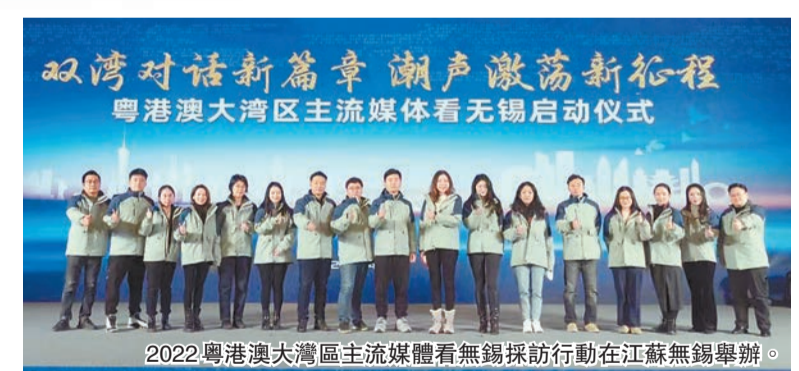
2022粵港澳大灣區主流媒體看無錫採訪行動在江蘇無錫舉辦。

近年來，江蘇無錫憑藉着十大千億級產業集群、超百家上市企業、8萬家工業企業、超百萬家市場主體的雄厚基礎，推動GDP連上7個千億級台階，達1.4萬億元，勇立人均GDP全國大中城市第一的發展潮頭，「百年工商名城」煥發新活力。在長三角與粵港澳全面協同發展的新篇章中，無錫努力深度融入新發展格局，在推動高質量發展中當先鋒、打頭陣。前不久，無錫市委全會又發出了「深入學習貫徹黨的二十大精神，在新征程上全面推進中國式現代化無錫新實踐」的動員令。