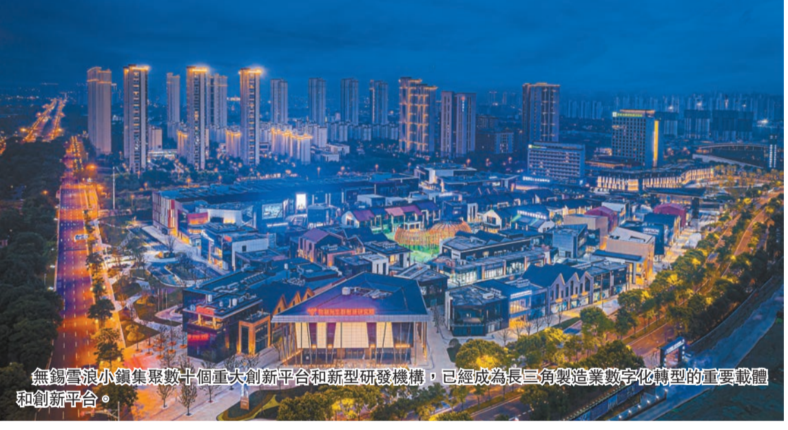
無錫雪浪小鎮集聚數十個重大創新平台和新型研發機構，已經成為長三角製造業數字化轉型的重要載體和創新平台。

無錫市商務局相關負責人介紹，無錫領先於長三角其他城市，率先在深圳全面布局「科創飛地」，分布於南山、寶安和龍華區等核心區域，累計簽約已入駐企業、待入駐和返錫落戶企業數已達88家。