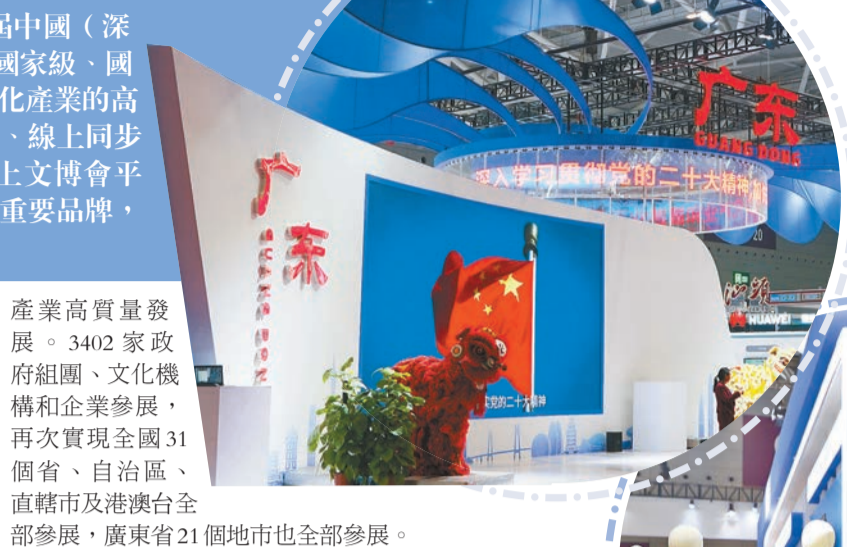
第十八屆文博會廣東館。

本屆文博會是在黨的二十大召開之年舉辦的一屆重要展會，也是落實好中央經濟工作會議部署，提振信心，推動經濟運行整體好轉的重要舉措。本屆文博會積極引進國內外高端文化產業資源，着力打造高水平文化產業展示和交易平臺，推動文化