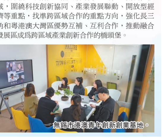
無錫市港澳青年創新創業基地。

據介紹，下階段，無錫將瞄準全局性、關鍵性領域，圍繞科技創新協同、產業發展聯動、開放型經濟等重點，找準跨院院士合作的重點方向，強化長三角和粵港澳大灣區優勢互補、互利合作，推動融合發展區成為跨區域產業創新合作的橋頭堡。