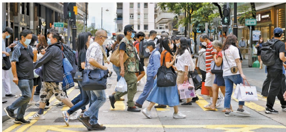
香港研究協會公布一項民調結果，近半數受訪市民稱2022年過得開心，對來年的民生信心亦上升。

【香港商報訊】記者萬家成報道：2022年即將過去，香港研究協會昨日公布一項最新民調結果，指於12月18至28日展開全港隨機抽樣電話訪問，成功訪問了1023名18歲或以上市民，以了解市民對今年2022年及來年2023年生活的意見。調查結果顯示，近半市民稱2022年過得開心，而2023年市民民生信心亦創2008年以來新高。