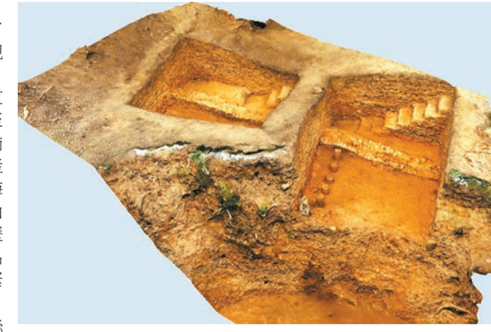
文頭嶺窯龍窯遺址。

海上絲綢之路作為一項持續時間2000多年、範圍覆蓋大半個地球的人類歷史活動，得到了聯合國教科文組織和世界遺產專家的高度重視和關注。歷史上，佛山深度參與陸海貿易循環，一直是海上絲綢之路沿線重要城市之一。自古至今，佛山是製造業名城、商貿重鎮，以手工商貿名揚宇內，據史籍記載，宋代以後，佛山產的陶器、鐵器、絲綢、白鉛等產品暢銷海外，是海絲貿易的「硬貨」，在明清時期佛山更位列天下「四大鎮」「四大聚」，豐富的歷史文化遺產資源述說佛山作為國家歷史文化名城的深厚底蘊，與海上絲綢之路歷史發展的緊密聯繫。近年來，佛山文化文物部門深入挖掘海上絲綢之路文化遺產價值，持續推進以奇石窯址、文頭嶺窯址為重點的「海絲」史跡的保護利用。2021年，由廣東省文物考古研究院聯合佛山市、區兩級相關文博機構，對奇石窯址、文頭嶺窯址開展調查與發掘工作。結果顯示，在奇石窯和文頭嶺窯發現了宋代少見的平焰式斜坡龍窯和障焰柱斜坡龍窯，出土大批層位明確的器物標本，結合前期考古調查資料，綜合運用類型學及科技考古方法，確認了「南海1號」等東南亞古代沉船與南越國宮署遺址宋代堆層出土的醬