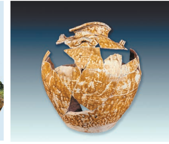
奇石窯出土的四系醬釉罐。

釉大罐等器物產自奇石窯址和文頭嶺窯址。佛山市副市長周紫霄表示，下一步佛山將以加入「海絲申遺城市聯盟」為契機，積極參與「海絲申遺城市聯盟」的保護利用、交流合作，依託考古發現，繼續挖掘佛山海上絲綢之路申遺潛能，扎實開展奇石窯和文頭嶺窯等「海絲」史跡的保護與研究。佛山將以「三個一」路徑挖深護好用活本地海絲歷史資源：統籌一系列研究升級，深化調查研究，明確奇石窯