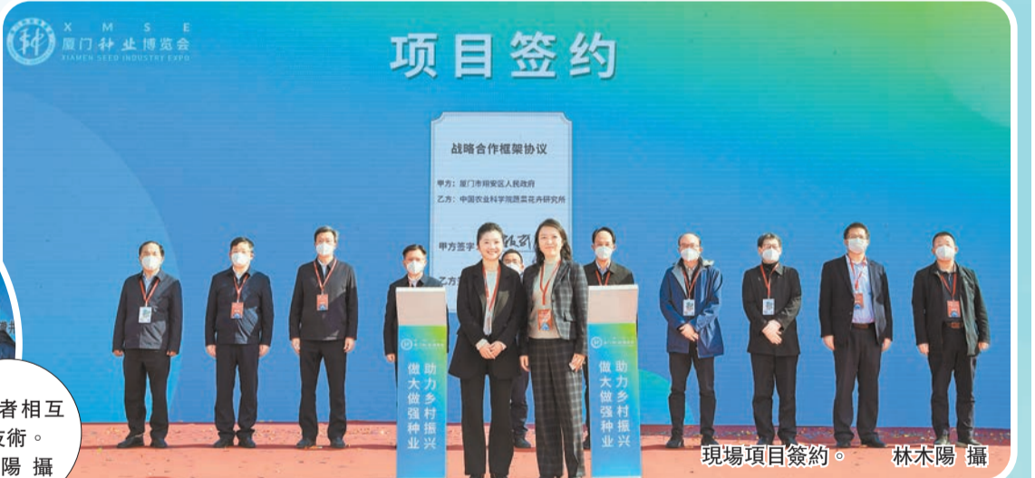
現場項目簽約。

當日下午，種子種苗產業大會暨鄉村振興投資論壇在廈門佰翔五通酒店召開。大會論壇圍繞農業投資現狀、種業發展現狀和未來趨勢、金融助農等主題展開。大會上還展示了種業和鄉村振興的相關報告，並推介一批翔安區乃至全國各地市的種業科研前沿領域的最新成果。