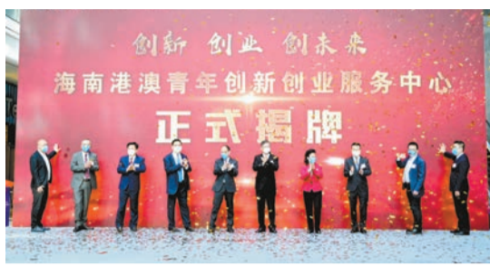
海南港澳青年創新創業服務中心揭牌。

服務中心將深度對接瓊港澳三地信息資源，爭取瓊港澳創新創業政策，集合瓊港澳三地優質智庫專家力量，打造信息交互中心、活動企劃中心、服務落地中心三大服務職能，幫助來瓊港澳青年盡快緩解創業初期階段「水土不服」的狀態。