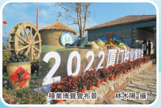
種業博覽會布景。林木陽攝