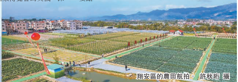
翔安區的農田航拍。許秋琦攝