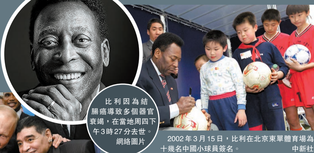
2002年3月15日，比利在北京東單體育場為十幾名中國小球員簽名。

巴西1970年冠軍隊成員、與比利並肩多年的李維連奴表示，比利是永遠的王者，現時已轉到上帝的身邊，希望他安息。