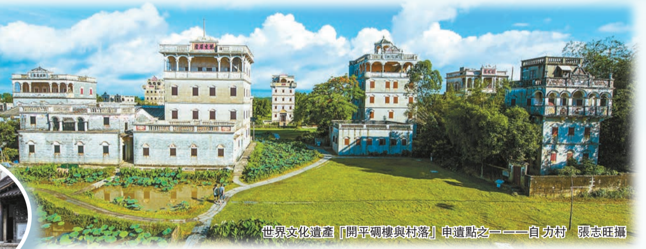
世界文化遺產「開平碉樓與村落」申遺點之一——自力村