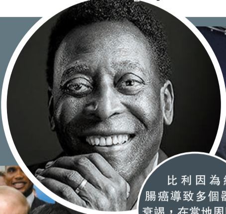
比利因為結腸癌導致多個器官衰竭，在當地周四下午3時27分去世。

【香港商報訊】當地時間29日，巴西球王比利逝世，終年82歲。比利的女兒在社交網站公布父親的死訊，表示永遠愛他，願父親安息。醫院的報告顯示，比利因為結腸癌導致多個器官衰竭，在當地時間周四下午3時27分去世。巴西政府當天在官方公報上宣布，自即日起該國為比利去世哀悼三天。