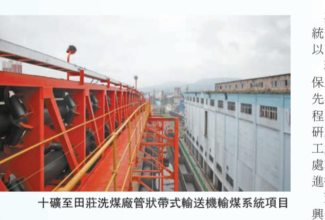
十礦至田莊洗煤廠管狀帶式輸送機輸煤系統項目

其徐如林，即行動緩慢時像樹林步調一致、行動統一。環保工程投資大、周期長、流程複雜，需要以「徐如林」的姿態穩步推進。 環保節能公司旗下子公司天成環保公司，擁有環保工程專業承包壹級資質等稀缺資質，自成立以來先後完成了廢水、廢氣、廢渣、噪聲等各類環保工程400多項，積累了豐富的技術儲備，具備較強的科研創新優勢、人才優勢和平台優勢，尤其是精細化工程廢水處理水平位居行業前列，曾先後對糖精廢水處理、針狀焦廢水處理、尼龍廢水處理等行業難題進行積極探索並取得顯著成果。 天成環保公司代表性項目亮點突出。例如，開封興化糖精生產過程中無組織VOCs處理項目，為全