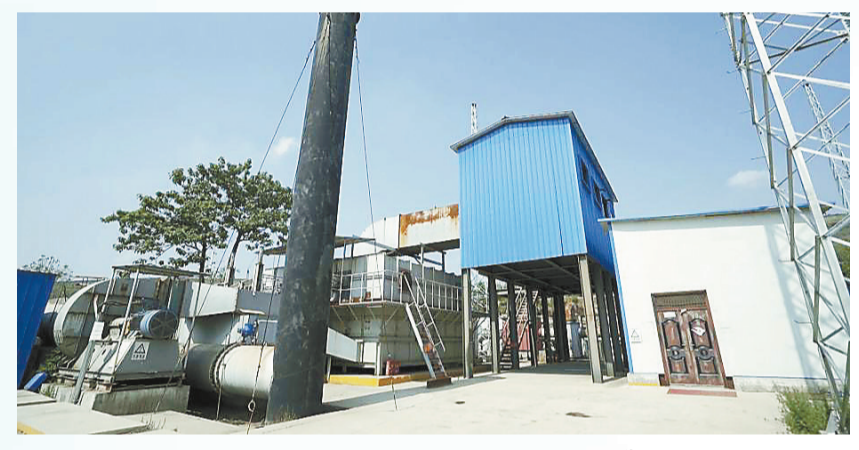
五礦低濃度瓦斯氧化供熱項目

動如雷震，即流動的涓涓礦井水，也是雷厲萬鈞之勢。 環保節能公司旗下模塊化子公司——環保設施運維公司，在現有已集中運維污水處理廠的基礎上深度推廣集中運維業務，籌劃建設工業污水運維及綜合利用中心，三年內計劃實現對集團公司15-20家企業污水處理廠的集中運維，至2024年，實現運維工業污水處理規模3000萬噸/年。 對集團污水處理廠實行集中運維，並不是簡單的統一管理，而是以推進標準化、智慧化建設的方式實現以「以智提質」，以北部礦區廢水分質梯級資源化的方式實現「動水盈礦」。 污水處理廠智慧化運營，是通過智能感知、雲計算和中央控制等手段，實現污水治理專業化、運營管理智能化、站區看守無人化、人員管理規範化和響應機制快速化，徹底扭轉當前各水廠存在的自動化程度低、精確控制性差、缺乏科學系統控制、過程控制和系統優化方案等缺點，杜絕運行過程中大量人力資源和能源浪費。 北部廢水分質梯級資源化，是以集團平頂山北部礦區礦井尾水產生情況、水資源需求情況為支撐，開展北部礦區工業污水梯級資源化利用技術研究，統籌考慮各單位的排水及用水情況，將礦井水、生活污水、化工廢水等污水進行分質分類處理，並將處理後的清水分質分類進行合理的資源化利用，成果轉化應用後，可實現年產純水110萬m 3 能力，並實現集團整體意義的廢水零排放。 涓涓礦井水，也有雷電勢。在不遠的將來，我們一定會看到這樣的場景：在環保節能公司的中央控制大屏上，就能看到集團各污水處理廠運行情況，實時水質自動檢測系統自動運轉，提醒各水廠根據水質變化情況，及時調整藥劑參數。如果有煤礦缺水，不用再花錢從外面買水，而是直接聯環環保節能公司。在環保節能公司的統籌安排下，可將其他礦的富餘礦井水，通過北部礦區水道管網實現調配流動，實現集團內部水資源「互通有無、調劑餘缺」。 「其疾如風、其徐如林、侵掠如火、不動如山、動如雷震」，是《孫子兵法》中，對優秀軍隊應面對各種情況時，應展示出正確應對姿態的精準描述。 環保節能公司作為集團唯一的「環保管家」，是「大氣污染、水污染、土壤污染保衛戰」「五年近零排放行動攻堅戰」當仁不讓的排頭兵、主力軍，在歷次戰役中奮勇爭先，以卓越功績，在中國平煤神馬集團綠色發展史上寫下光輝一頁。 黨的二十大報告，將「推動綠色發展，促進人與自然和諧共生」作為新時代新征程中國共產黨的重要任務之一。在思想上強調「必須牢固樹立和踐行綠水青山就是金山銀山的理念」，在理念上倡導「一體化保護」「系統治理」「統籌發展」，在舉措上明確了「加快發展方式綠色轉型」「深入推進環境污染防治」「提升生態系統多樣性、穩定性、持續性」「積極穩妥推進碳達峰碳中和」的路徑。 耕耘更知韶光貴，不待揚鞭自奮蹄。未來，環保節能公司將堅持以黨的二十大精神為指引，深刻把握「六個堅定」，牢記初心使命、主動擔當作為，弘揚特別能吃苦、特別能戰鬥、特別能奉獻的鐵軍精神，展示出更加昂揚向上的戰鬥姿態，為中國平煤神馬集團邁向世界一流企業貢獻更多的智慧和力量。