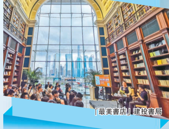
「最美書店」建設書局