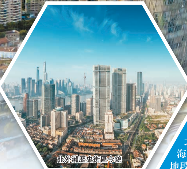
北外灘歷史街區今貌