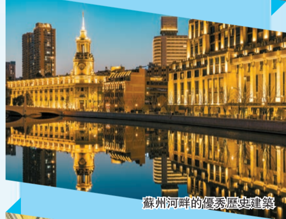
蘇州河畔的優秀歷史建築