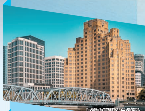
上海大廈與外白渡橋

北外灘將以國際級消費集聚區為建設目標，圍繞「鏈接全球、買賣全球、服務全球」提升資源配置能力，打造「全球消費資源集聚區、消費市場新高地和消費潮流風向標」。白玉蘭、來福士、太陽宮等大型綜合體已投入運營，湧現了城市集市等多個火出圈的現象級品牌。「首店經濟」「夜間經濟」和「老字號品牌」在這裏大放異彩，構成一幅新時代北外灘的「清明上河圖」。