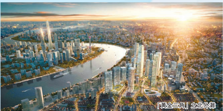
「黃金三角」之北外灘