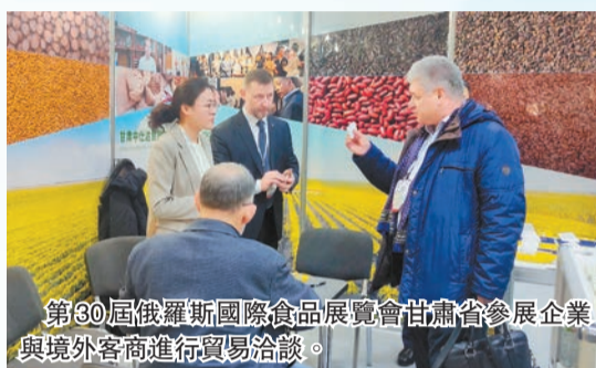
第30屆俄羅斯國際食品展覽會甘肅省參展企業與境外客商進行貿易洽談。

商、招大商，大引資、引大資。年初，甘肅創新改進招商機制，加大招商引資力度，實現了招商引資「開門紅」。1月，該省共實施新建、續建省外招商引資項目161個，到位資金99.95億元，到位資金同比增長145.58%。2月初，由甘肅省對外貿易協會及13家外貿企業組成的經貿代表團，赴俄羅斯莫斯科參加了「第30屆俄羅斯國際食品展覽會」。作為甘肅自2019年新冠疫情以來出訪的第一個經貿團組，展會期間開展了產品展示、貿易對接、產業推介、訪問交流、蘭洽會邀請等系列活動，首團出海成果豐碩。