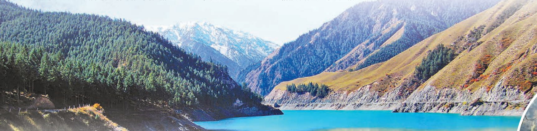
祁連山國家級自然保護區一景。