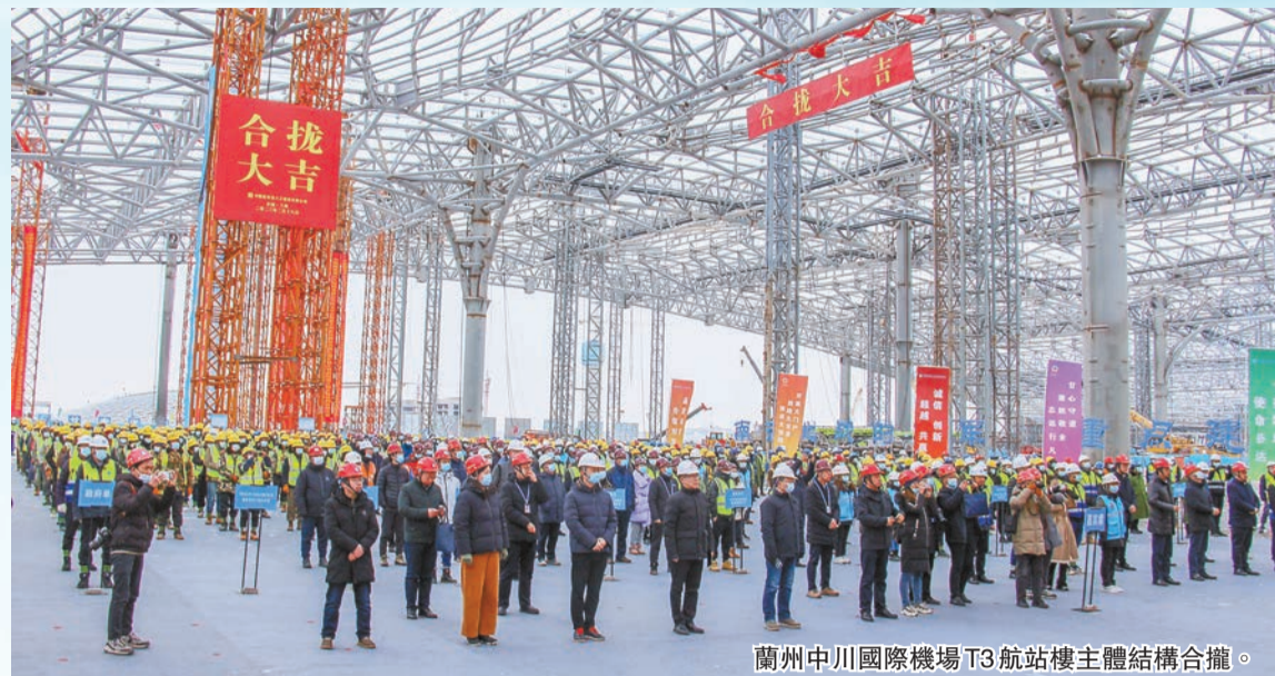
蘭州中川國際機場T3航站樓主體結構合攏。

為此，甘肅省委、省政府主要領導既掛帥又出征，與企業家面對面交流，用心用情推介甘肅，帶頭大招