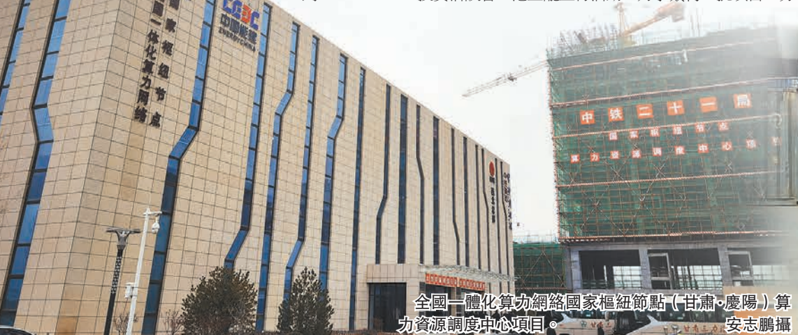
全國一體化算力網絡國家樞紐節點（甘肅-慶陽）算力資源調度中心項目。