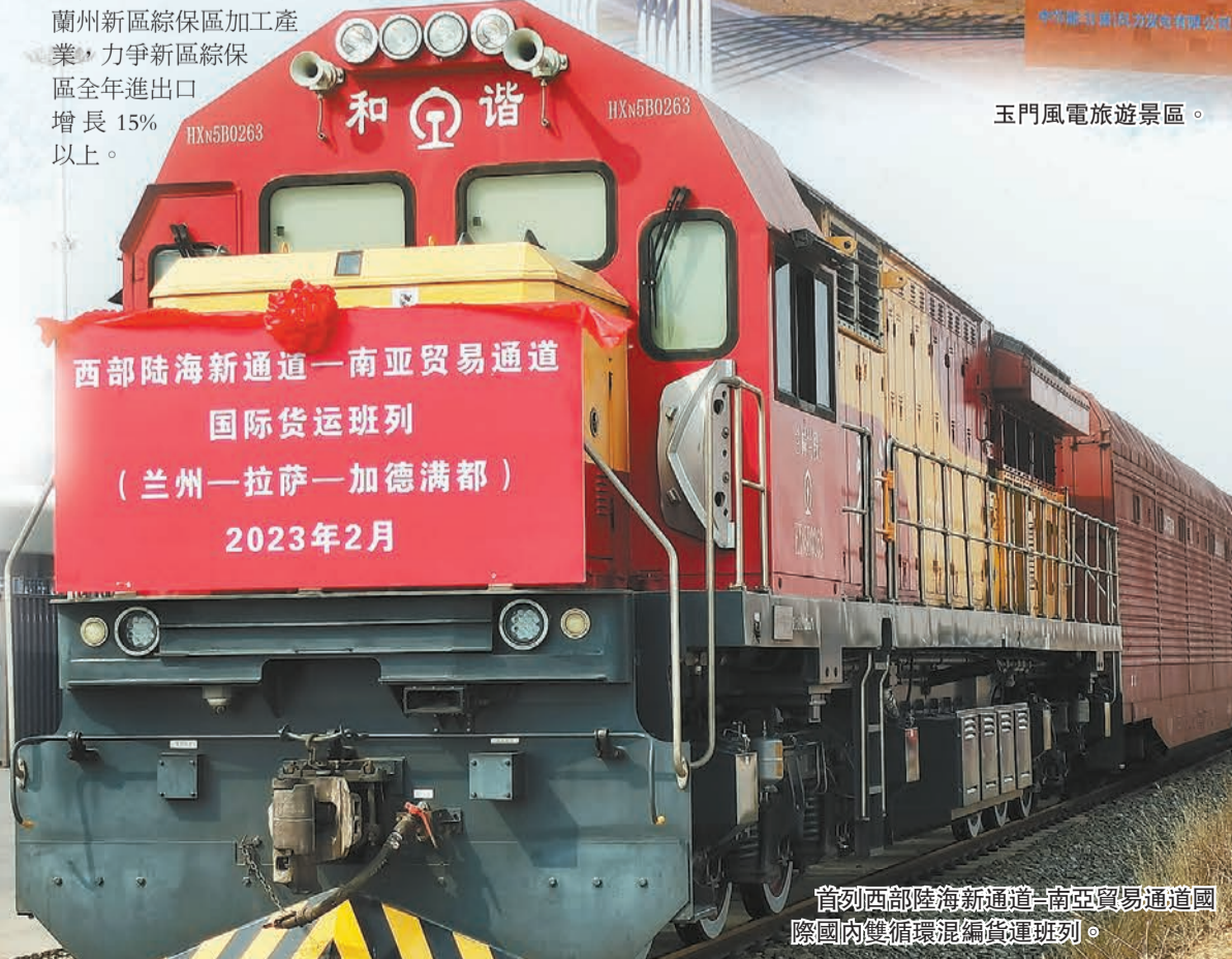
西部陸海新通道—南亞貿易通道 國際貨運班列 (蘭州—拉薩—加德滿都) 2023年2月