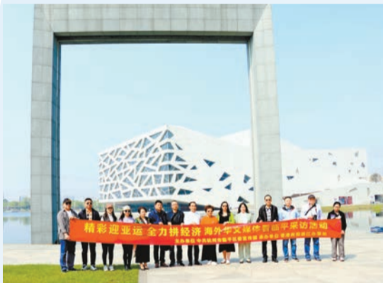
海外華文媒體採風團。

採風團臨平之行的第一站，來到了國家3A級景區——藝尚小鎮。小鎮建設融合傳統與現代、歷史與時尚、自然與人文，在3平方公里的有限空間裏，藝尚小鎮呈現了代表江南水鄉的千年東湖、江南村