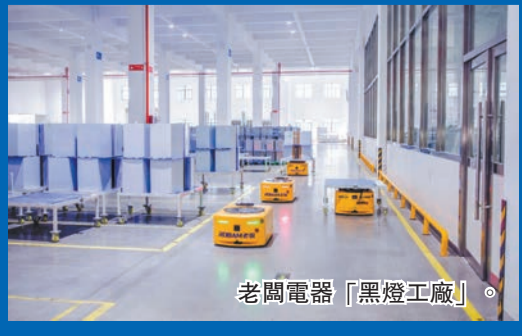
老闆電器「黑燈工廠」。

老闆電器是臨平區數字化轉型升級的首批企業，也是浙江省首個5G SA獨立組網的工業製造試點。老闆電器未來工廠採用5G大數據感知、採集、邊緣計算技術、AI算法，最大程度與傳統雲計算在架構、接口、管理等關鍵能力上實現統一。在廚房電器鈹金製造過程中，16條無人生產線所有環節，包括上下料機器人以及無人AGV，均採用系統計算智能作業。老闆電器擁有行業內建成的第一條集煙罩自動生產線，產線將13道工序串聯起來，一塊平整的板材經過一條90米的產線，就能變成一個集煙罩，產品精度達0.2毫米，方便接下來焊接機器人進行作業。對於肉眼發現不了的問題，則交給5G視覺檢測系統。通過5G互聯網技術，車間生產設備全部接入工業互聯網數字平台，實景和數據融合，讓所有點位的物料實現自動流轉和預警。