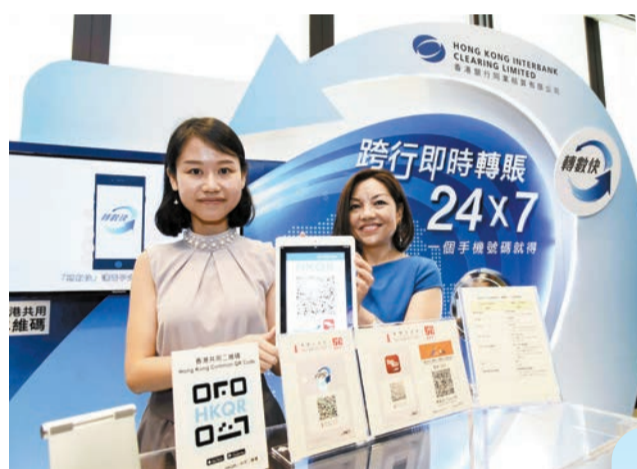
香港「轉數快」(FPS)及泰國「PromptPay」在兩地跨境付款，有可能於今年11月接通。資料圖片

「走出去」提供良好契機，展業過程需要銀行熟悉粵港澳三地的金融投資政策法規。他續稱，當局將指導內地試點銀行與香港和澳門銀行建立緊密合作機制，在帳戶服務、跨境金融服務、系統對接、信息管理、投資者權益保護等開展全面合作，形成一套適應三地法律框架和監管要求的業務模式。