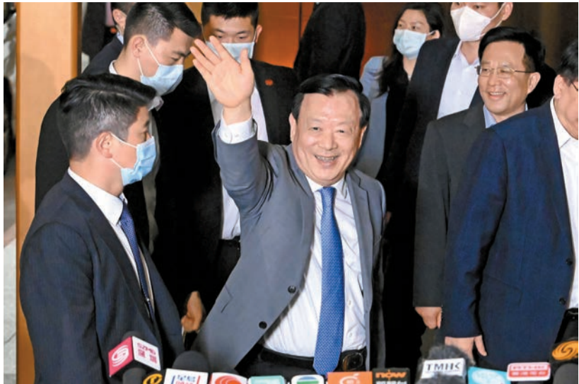
昨日，國務院港澳事務辦公室主任夏寶龍（中）結束在香港的考察，離港前在香港國際機場向傳媒揮手。

【香港商報訊】記者戴合聲報導：國務院港澳辦主任夏寶龍昨展開第六天考察香港行程後乘飛機離港。行政長官李家超在總結時表示，夏寶龍主任此行考察範圍廣泛、多元，行程非常緊密，包括在「全民國家安全教育日」作主旨講話、與社會各界人士會面，並到多區實地考察，十分認真、深入及投入，充分反映了中央及夏寶龍對香港的關心和重視。李家超引述夏寶龍主任多次表示對香港的未來充滿信心，並承諾特