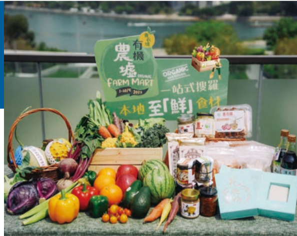
復活節限定一連四日有機農墟。

青衣城「綠『惜』優惠」推廣活動於4月1日起展開，讓大家可以低至六五折的優惠價購買一系列環保綠色商品！推介包括符合一級能源標籤規格的精選家電及以粟米澱粉提取的環保材質製成而成的Sorona系列服裝等。顧客可享用優惠價購物，並參與「綠『惜』生活6倍賞」，在場內指定27間綠色商戶消費即可賺取高達6倍MTR分獎賞。推動「綠色消費」，從衣着、打扮、飲食、生活等多方面，活出低碳環保新態度！