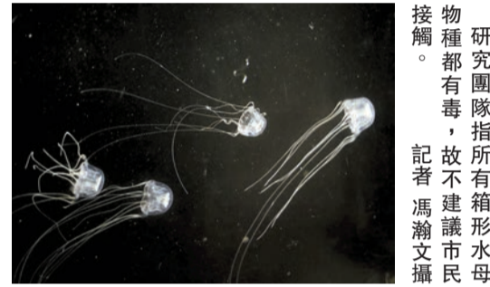
物種都有毒，故不建議市民接觸。研究團隊指所有箱形水母。

另外，據了解海洋公園水母館已對外展示15個水母物種，長遠都有計劃展示「米埔三槳水母」，詳情會稍後再作公布。