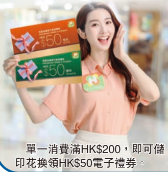
單一消費滿HK$200，即可儲印花換領HK$50電子禮券。

【香港商報訊】恒基地產旗下的七大商場推出了「消費券多重獎」活動，活動時間為4月16日至5月31日。H·COINS會員只需在商場內消費一定金額，即可獲得多重回饋。單次消費滿HK$200即可獲得HK$50電子禮券，還可額外獲得高達HK$750的回饋。此外，新會員註冊後即可獲得3000 Coins，消費HK$1即可兌換1 Coin，享受超過400家商戶全年的折扣優惠。H·