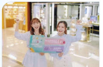
「德福廣場購物節」載譽歸來。

通過MTR Mobile，你還可以免費參加「每日有德賞」活動，每天都有不同的獎勵，包括400萬港元的優惠券大派送，以及來自餐飲、電子產品、美容、時尚、運動商戶的不同獎品或禮券等。從4月1日至6月30日，在港鐵商場使用滙豐信用卡消費，最高可獲得215000 MTR分！