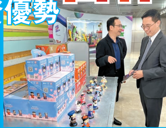
▲楊潤雄（右）參觀深圳市當代藝術與城市規劃館。

《粵港澳大灣區文化和旅遊發展規劃》明確指出香港作為國際城市旅遊樞紐和「一程多站」示範核心區的定位。楊潤雄指在國家支持下，香港定可善用完善的跨境基建和豐富的旅遊資源，與大灣區各省市共同打造大灣區成為世界級休閒灣區。他表示，近年港深兩地政府均致力建設大型文化設施、促進文化與科技結合、培育人才，港深兩地同根同源，也有相似的發展策略方向，應當抓住黃金機遇積極推動兩地協同發展。