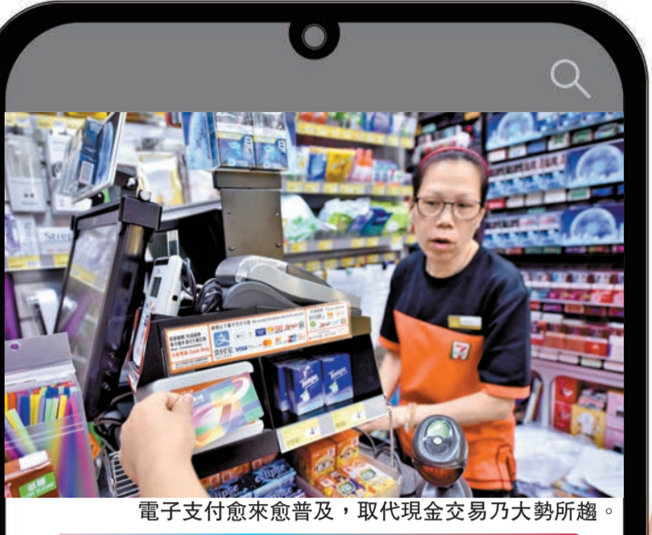
電子支付愈來愈普及，取代現金交易乃大勢所趨。

目前信用卡為本港主要的支付方式，去年交易額佔電子商務市場份額的41%，佔店內消費市場份額的55%(見表)。報告表示，電子錢包是增長最快的店內消費支付方式，預計2022年至2026年的交易價值將上升71%。