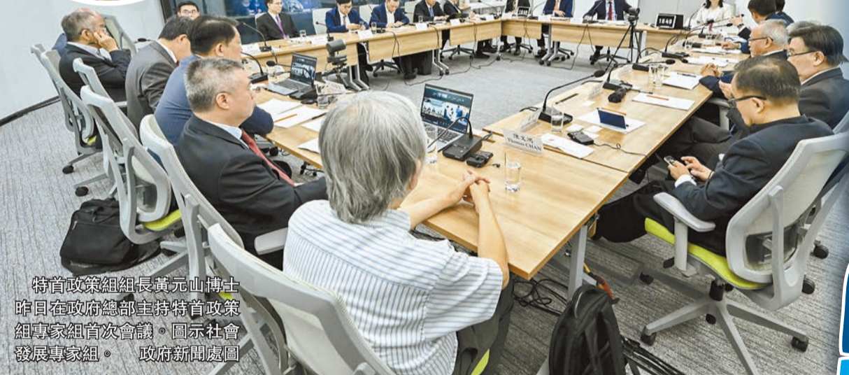
特首政策組組長黃元山博士昨日在政府總部主持特首政策組專家組首次會議。圖為社會發展專家組。

【香港商報訊】記者馮仁樂報道：上月底成立的特首政策組專家組，昨日舉行首次會議，會議按專家組成員分組分三節舉行，分別為經濟發展專家組、社會發展專家組和研究策略專家組，由特首政策組組長黃元山主持會議，會上探討本港如何實現高質量發展。