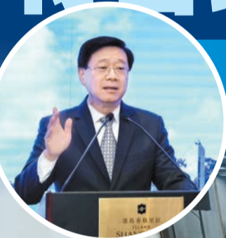
李家超在歡迎酒會與專家們交流，並感謝他們接受邀請成為專家組成員。