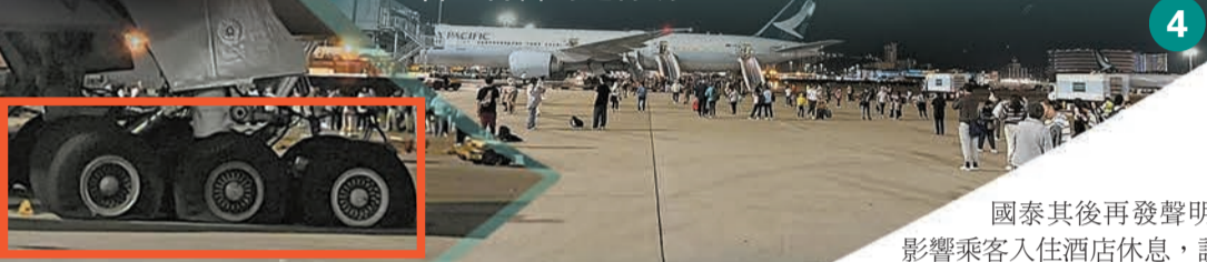
客機其中一組尾轆多個輪胎變形凹陷。

國泰其後再發聲明，指已安排受影響乘客入住酒店休息，調配另一航機運作CX880航班前往洛杉磯，將於10時出發，需在當地轉機的旅客將會獲安排其他航班前往目的地。同時為正在醫院接受診治的乘客及其家屬提供所需協助。