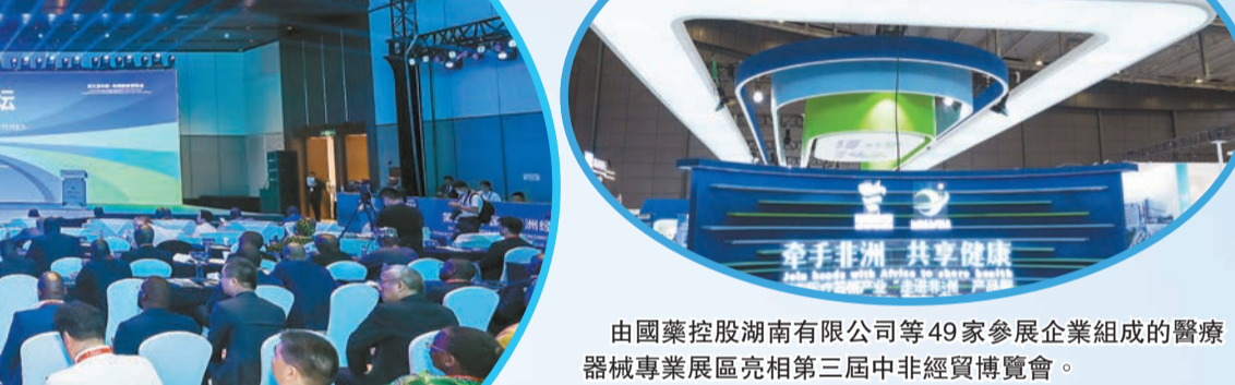
由國藥控股湖南有限公司等49家參展企業組成的醫療器械專業展區亮相第三屆中非經貿博覽會。

隊員為非洲人民提供醫藥健康服務，救治患者近100萬人次，為受援國培訓醫務人員9000多人次，接收非洲來湘培訓學員1500名。2015年，塞拉利昂總統比奧向湖南省援塞拉利昂醫療隊頒發了該國最高榮譽「金字獎章」；2022年，津巴布韋副總統、衛生部長奇溫加向承辦援外醫療隊派選任務的湖南省衛生健康委頒發感謝獎牌，授予中國（湖南）第19批援津醫療隊津巴布韋共和國「卓越勳章」。2020年，湖南省在津巴布韋首都哈拉雷建立了南部非洲最大的中醫針灸中心，該中心取得津巴布韋第一家中醫類診療機構資格認證。