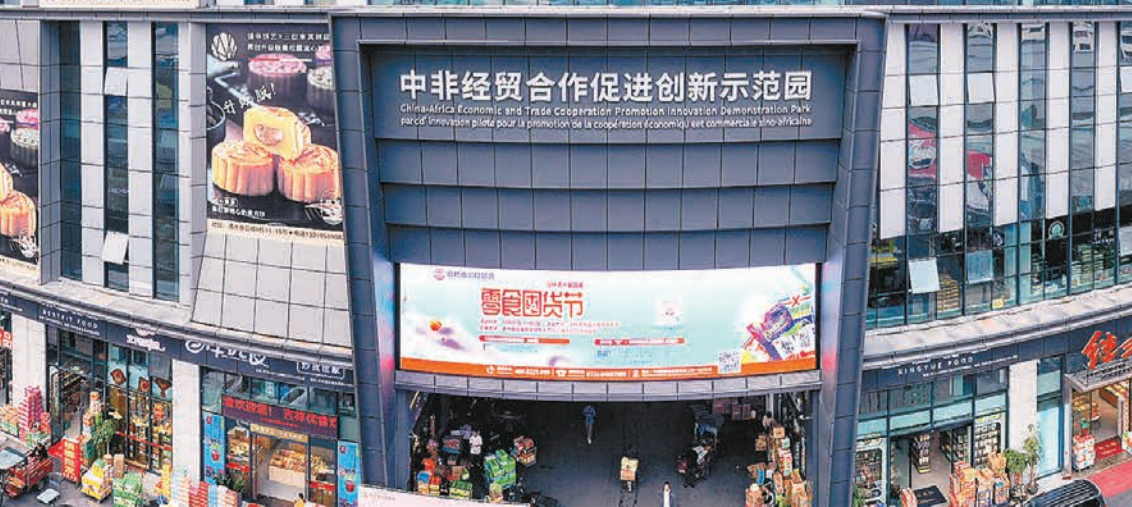
湖南自貿試驗區長沙片區雨花區塊依託高橋大市場，高標準建設中非經貿合作促進創新示範園。

征程萬里風正勁，重任千鈞再出發。隨着第三屆中非經貿博覽會的成功舉辦，湖南定將以此為動力，推動對非經貿合作向全方位、多層次、高質量發展，為構建更加緊密的中非命運共同體貢獻更大力量。