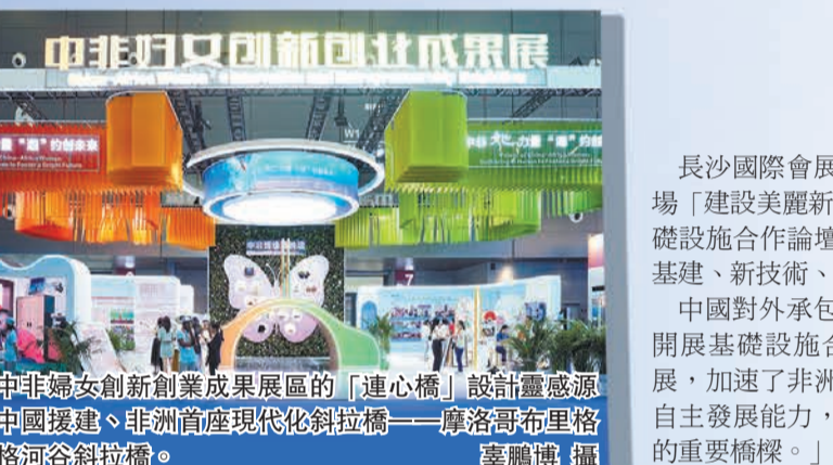
中非婦女創新創業成果展的「連心橋」設計靈感源自中國建橋、非洲首座現代化斜拉橋——摩洛哥布里格河斜拉橋。

從長沙國際會展中心的室外展區，三一重工帶來了一場「建設美觀新非洲」的機械盛宴；6月29日，中非基礎設施合作論壇在長沙國際會議中心舉辦，掀起了新基建、新技術、新能源的思想碰撞。