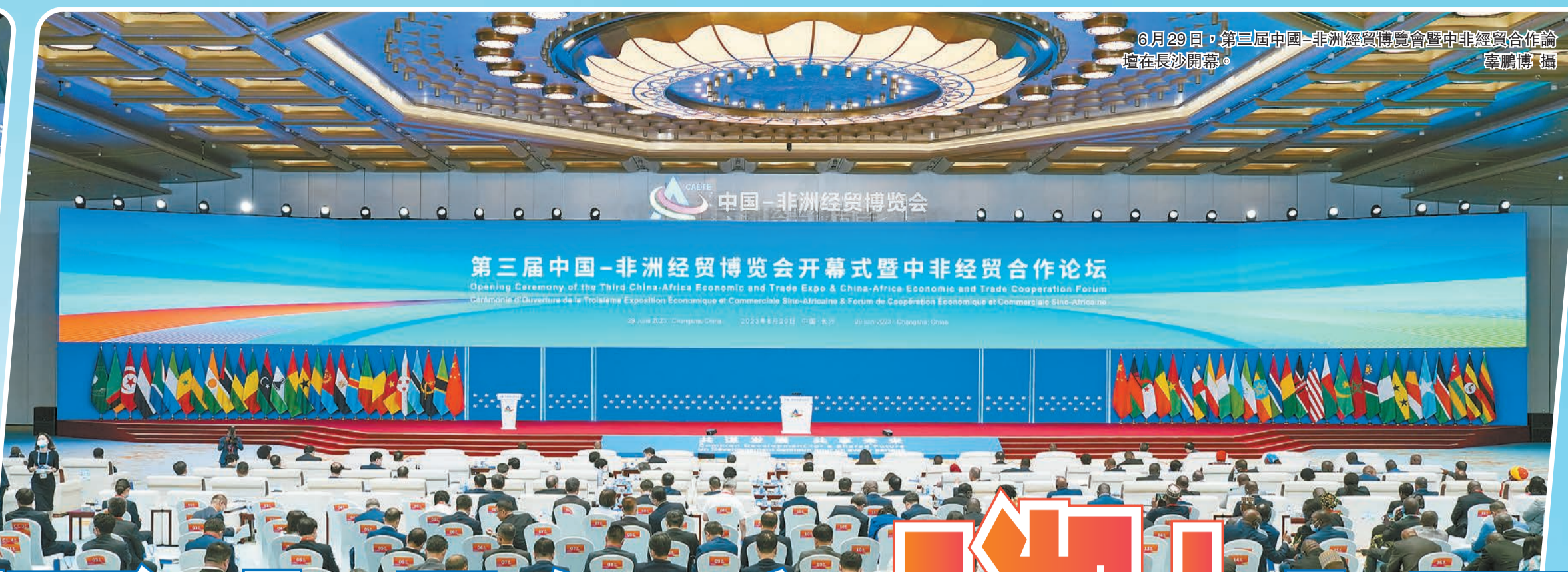
6月29日，第三屆中國-非洲經貿博覽會暨中非經貿合作論壇在長沙開幕。