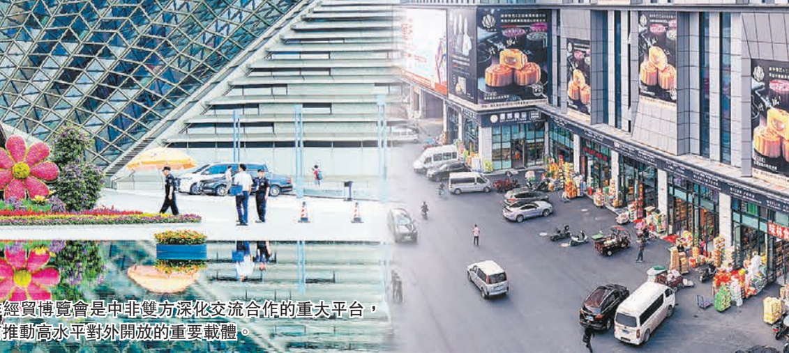
中非經貿博覽會是中非雙方深化交流合作的重大平台，是湖南推動高水平對外開放的重要載體。