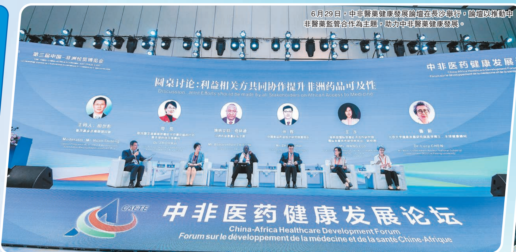
6月29日，中非醫藥健康發展論壇在長沙舉行，論壇以推動中非醫藥監管合作為主題，助力中非醫藥健康發展。

中非經貿博覽會是中非雙方深化交流合作的重大平台，是湖南推動高水平對外開放的重要載體。湖南對非合作碩果滿枝，既有國家政策的加持，又有大型國際舞台的「近水」之便。2022年，湖南對非貿易總額556.6億元，較2021年增長42.8%；今年1至4月較2022年同期增長90%。 化定興