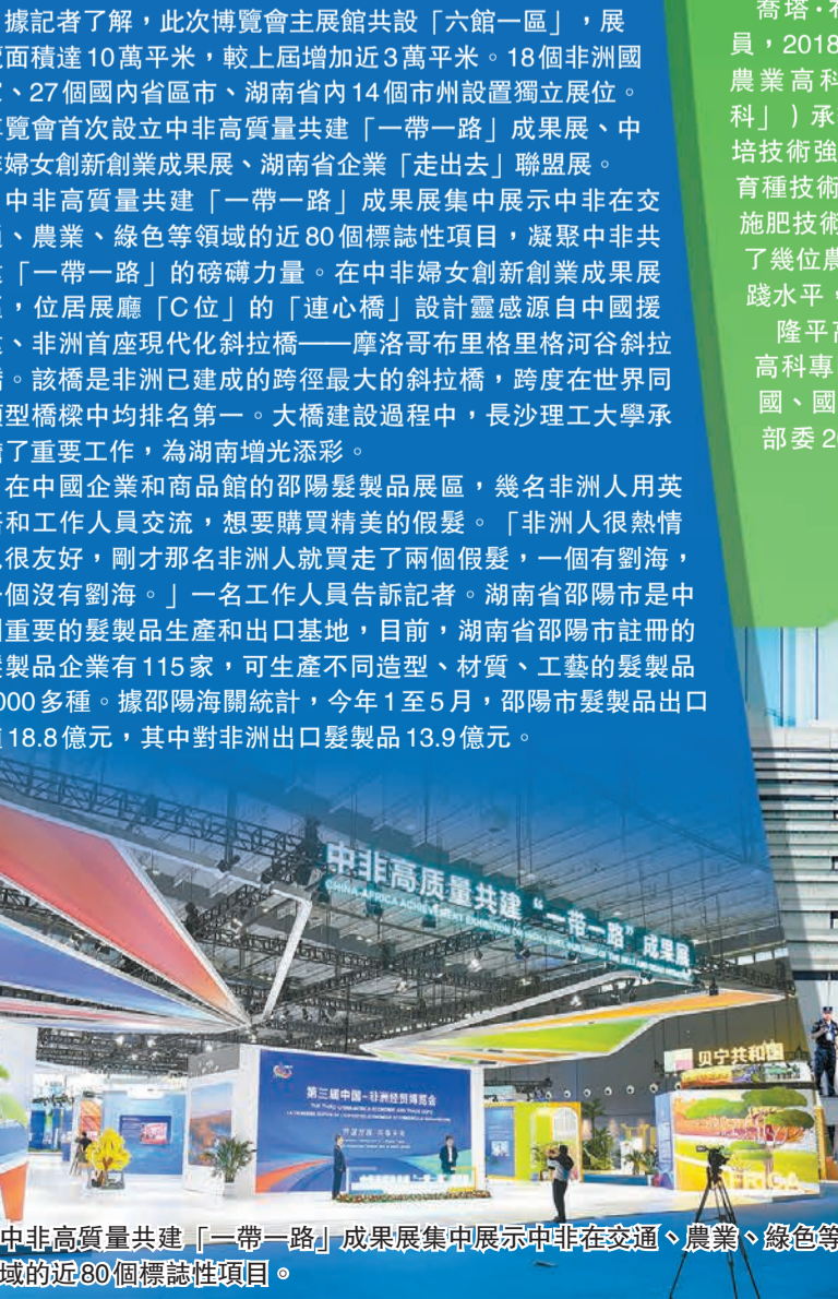
中非高質量共建「一帶一路」成果展集中展示中非在交通、農業、綠色等領域的近80個標誌性項目。