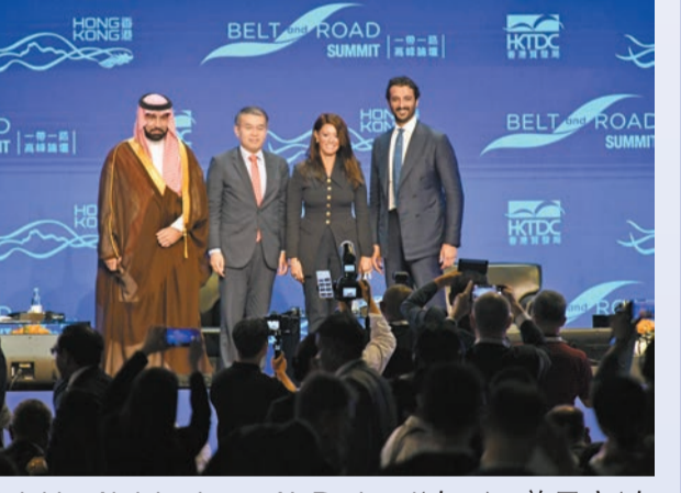
Fahd bin Abdulmohsan Al-Rasheed(左一)、許正宇(左二)、Rania Al-Mashat(右二)及Abdulla bin Touq Al Marri(右一)。

丘應樺表示，「一帶一路」合作重點在於加強各地的政策溝通、設施聯通、貿易暢通、資金融通和民心相通。十年間，中國與「一帶一路」國家之間的年均貿易額，由2013年的1萬億美元增至去年的2萬億美元，年均增長8%，成績斐然。他強調，互聯互通並非局限於人流和物流，而是尋求各方面合作，實現共建共贏。丘應樺又指出，很高興與香港一直是東西方之間的連接者，利用香港作為平台進入內地市場，是很好的選擇。