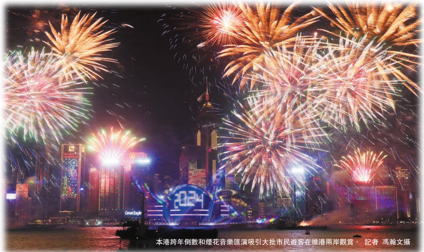
本港跨年倒數和煙花音樂匯演吸引大批市民遊客在維港兩岸觀賞。