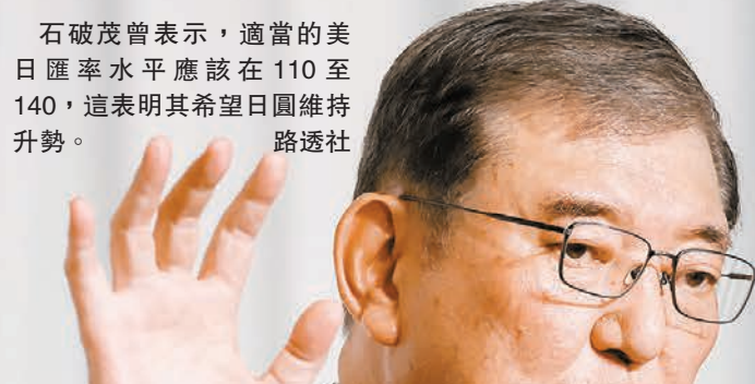
石破茂曾表示，適當的日匯率水平應該在110至140，這表明其希望日圓維持升勢。