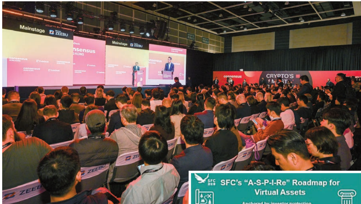
全球加密貨幣及Web3行業活動Consensus大會正在香港舉行，期間證監會公布本港虛擬資產發展路線圖。

產品方面，探討與證券市場風險管理保障相銜的虛擬資產存展融資要求，以及在明確的託管和營運指導下允許質押和借貸服務等，將豐富虛擬資產產品種類，滿足市場多樣化需求。基建方面，考慮部署先進監控工具偵測非法活動，加強與本地跨機構及全球監管機構的合作，提升市場監管效能，維護市場公