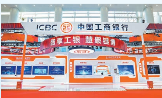
2024年11月，工商銀行作為中國國際供應鏈促進博覽會戰略合作夥伴參展，全方位展現該行在支持實體經濟、服務全球供應鏈、推進金融科技創新等方面的最新成果。

銀行業計提的撥備在一定程度上可以以豐補歉，平滑業績表現。劉珺表示，去年工行的不良資產、不良率均在下降，撥備覆蓋率在上升，利潤也實現了正增長。資產質量基礎更牢固，「安全墊」更加厚實，是用真正的利潤增長來促進資本市場的正向回報。