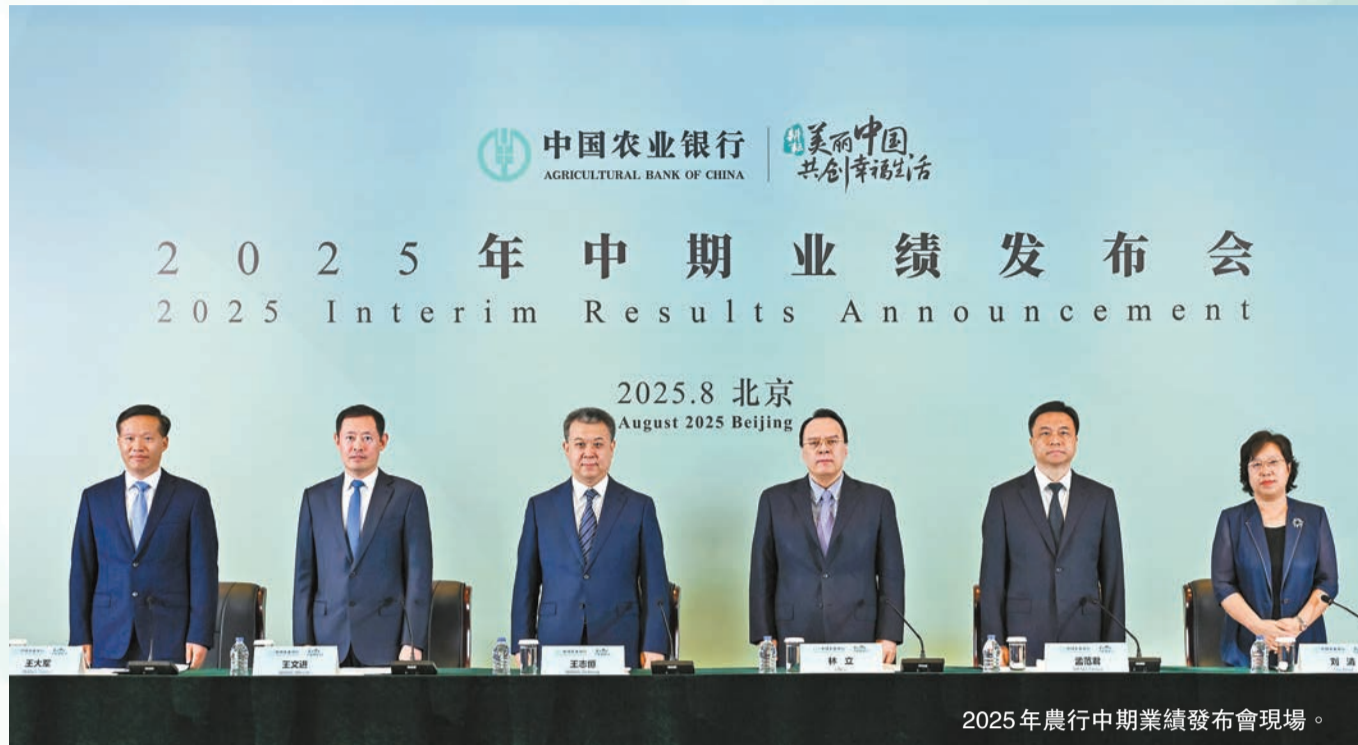
2025年農行中期業績發布會現場。