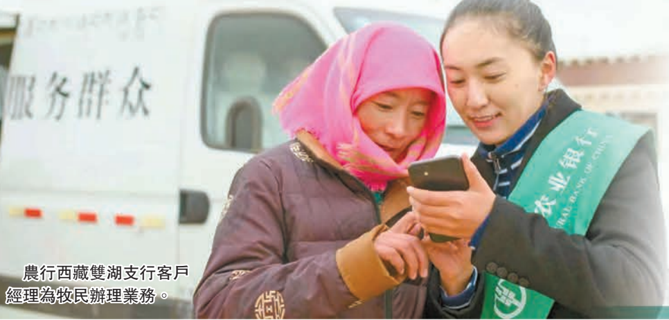
農行西藏雙湖支行客戶 經理為牧民辦理業務。

林立補充道，農行不斷強化集團一體化管控，精準化險能力不斷提升。重點領域方面，截至6月末，房地產貸款不良率較年初下降0.05個百分點；地方債的融資平台客戶數量和債務規模「雙下降」；普惠型小微企業貸款和信用卡不良率均處於可比同業最優水平。下半年，農行重點工作將在「控新」「降舊」兩個方面下功夫，不斷完善普惠零售風險防控體系，持續加強重點領域風險防控措施，主動開展前瞻性結構調整。