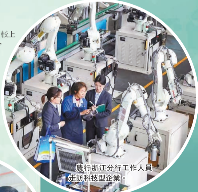
農行浙江分行工作人員 走訪科技型企業。

「上半年的經營成果為全年的高質量發展打下了堅實的基礎，管理層有更充分的信心來迎接新的挑戰和考驗。」展望下半年，王志恆表示，農行將繼續平衡好規模與定價，成本與收益，風險與盈利，以進一步鞏固經營業績穩中向好勢頭，力爭實現跨越周期的穩定盈利增長和股東回報。