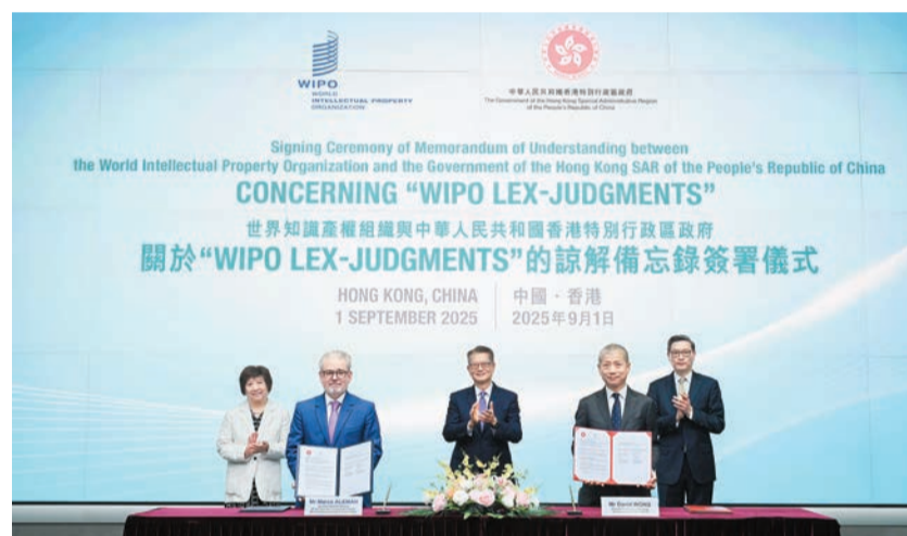
香港特區政府昨日與世界知識產權組織（WIPO）簽署有關「WIPO Lex裁判文書」數據庫的諒解備忘錄。

《2025年全球創新指數》世界百強創新集群發布活動由國家與世界知識產權組織主辦，並由香港特區承辦。發布活動同時亦邀請了來自香港及海外的