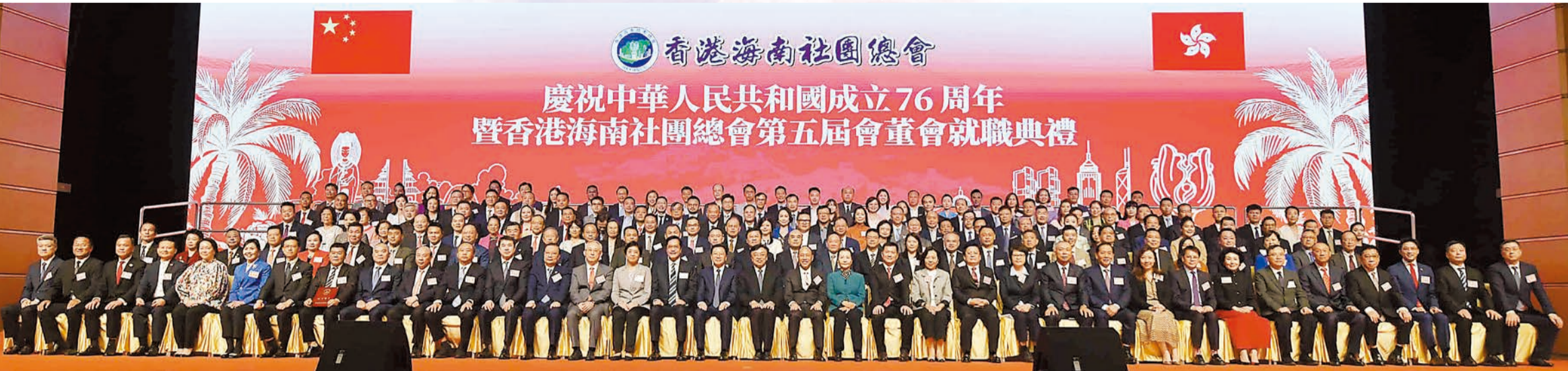
香港海南社團總會第五屆會董會就職典禮，賓主合照。

香港海南社團總會慶祝中華人民共和國成立76周年暨第五屆會董會就職典禮日前假香港會議展覽中心隆重舉行。李文俊連任會長。海南省委書記馮飛、中央政府駐港聯絡辦公室主任周霽、財政司副司長黃偉綸、全國政協港澳僑委會副主任崔玉英、中央統戰部三局局長王萍、駐港國家安全公署副署長陳楓、外交部駐港特派員公署副特派員李永勝、民政及青年事務局局長麥美娟等應邀擔任主禮嘉賓。中聯辦部門領導、特區政府官員、香港瓊屬社團首長、鄉親等超過1500人出席，場面盛大，氣氛熱烈。