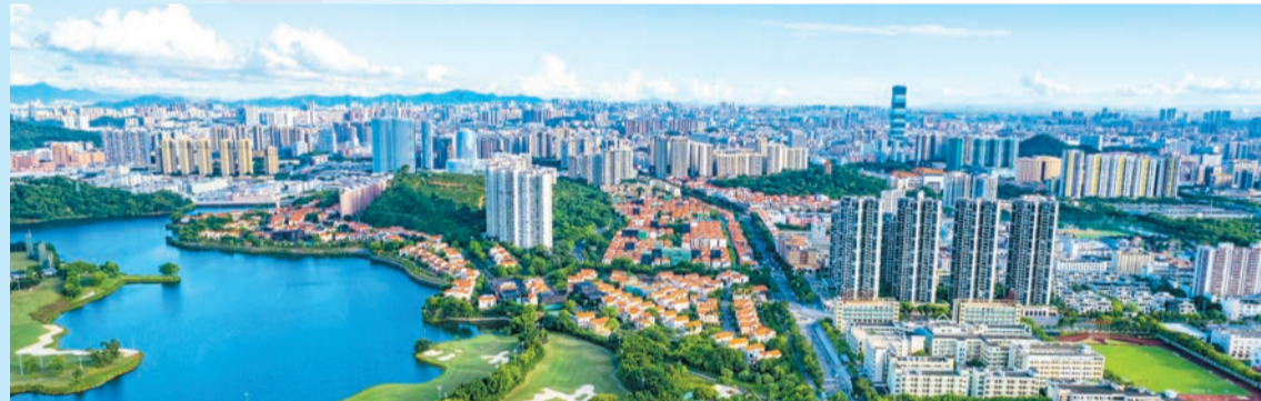
站在千億鎮的新起點，東莞長安開始「二次創業」。

秋日朝陽，溫暖和煦。沐浴晨光，東莞長安鎮的蓮花山草木蔥翠，清澈的茅洲河波光粼粼；山水之間，綠蔭深處，以OPPO、vivo、祥鑫科技等為代表的一批智能製造企業，以科創賦能技術更新，以先進智造助力「東莞製造」產品迭代更新，培育新質生產力，構建起千百億級的多元化產業，為排名「2025鎮域經濟全國500強」第四、廣東省第三個千億鎮——長安鎮「二次創業」注入強勁動能。