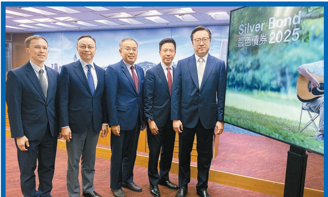
今年銀債無論認購金額及人數均較2024年分別增加約40%及約24%。 資料圖片

今年上半年，集團成功把握AI熱潮，服務器分部收益達25.64億元，按年勁升318.1%，成為增長引擎。此外，數據中心分部收益按年增66.8%至9.41億元，該兩分部收益佔上半年整體的比率高達72.2%。柯天然表示，未來集團將持續大力拓展AI相關的服務器分部及數據中心分部業務。