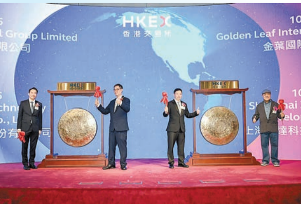
金葉國際、擊達科技首日掛牌。