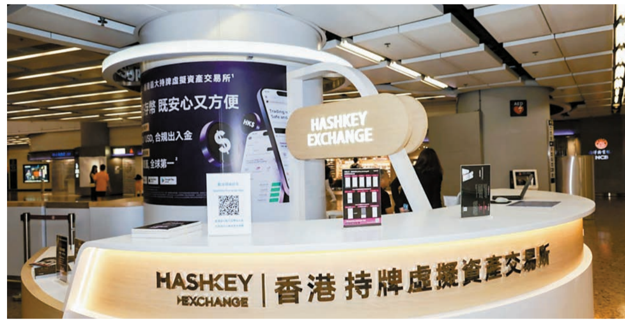
據報，香港持牌虛擬資產交易平台營運商 HashKey Exchange 已秘密申請在港上市。

盤便漲超一倍，收市報195.5元，升192%，成交額2.89億元，每手可賺6429元。擊達科技成立於2010年11月，主要為電動汽車家庭用戶提供安全的充電體驗以及智能的能源管理，目前其內地市場份額達13.6%，全球市場份額達9%。