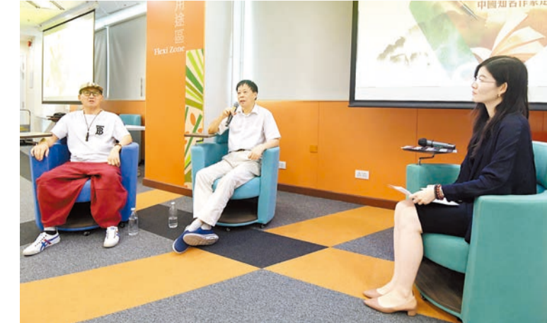
兩位文壇領軍人物於交流會期間就AI寫作議題擦出火花。