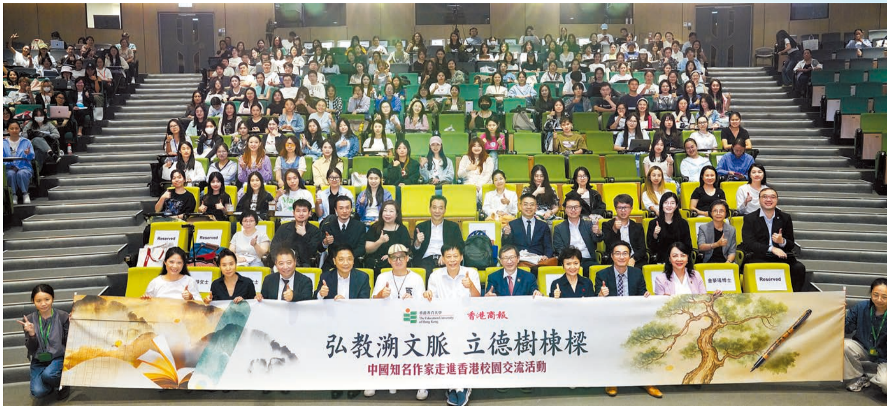
教大中國知名作家走進香港校園交流活動，邀得著名作家兼編劇黃亞洲(前右五)與衣向東(前左五)走進教大，與數百位師生展開多場有關文學的深度對話。

衣向東認為，想成為作家，必須具備多項技能，包括感知力、豐富的想像力、非常強的觀察力、表達力、模仿力及創造力。「在寫小說之前有個小技巧，就是設置這部小說的爆發點、設置人物的訴求。」他認為，寫小