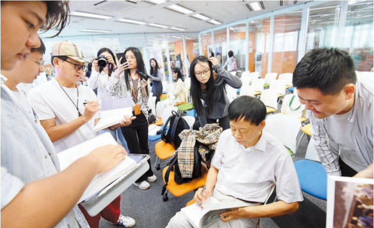
研究生熱情向兩名作家索取簽名留念。