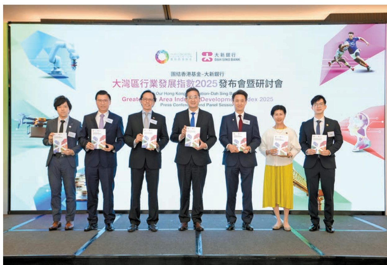
團結香港基金及大新銀行聯合發布《大灣區行業發展指數2025》。

金融服務方面，第一名的香港以85.6分大幅拋離次席的深圳接近10分，並按年錄得6.2%的增長。首次公開招股（IPO）市場強勢復蘇，上半年共有43隻新股上市，集資額列全球首位。年內股市交投活躍，上半年每日平均成交額達2400億元創歷史新高。8月實施的《穩定幣條例》更標誌着香港成為全球首批實施穩定幣監管框架的司法管轄區之一，彰顯香港打造數字金融中心的決心。 貿易及物流方面，香港以82.5分繼續保持樞紐地位，廣州排第二。儘管近10年來香港海運走勢弱，但空運進出口額的上升足以彌補海運的跌幅，整體進出口額除疫情期間以外仍錄得上升。最新數據顯示，香港進出口額創2021年以來新高，達9.5萬億元，比第二名的深圳高出一倍以上。雖然地緣政治持續為行業注入不確定性，但低空經濟和無人車的迅速發展正帶來新機遇。 文化及體育旅遊方面，香港取得79.3分再次居首，廣州幾乎與香港並駕齊驅。香港「基礎建設」取得重大突破，今年3月啓用的啟德體育園，截至9月中已舉辦超過30場體育盛事和演唱會；「經濟貢獻」方面，香港文體旅業增加價值連續兩年居首，按年增長13%。隨着全新體育基建落成，香港發展盛事經濟將更具優勢。