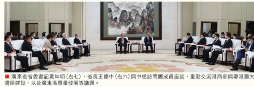
廣東省委書記黃坤明（右七）、省長王偉中（右六）與中總訪團成員座談，重點交流港商參與粵港大灣區建設，以及廣東高質量發展等議題。

省省委書記黃坤明、廣東省省長王偉中及廣州市市長郭永航等領導，重點交流港商參與大灣區建設、廣東高質量發展等議題，推動粵港加強合作，在金融、商貿、航運、創科以至藝術文化交流等領域全面深