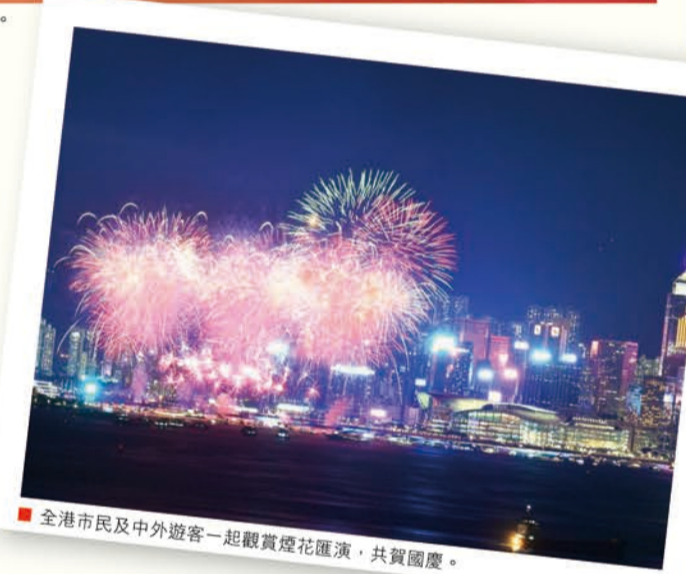
全港市民及中外遊客一起觀賞煙花匯演，共賀國慶。