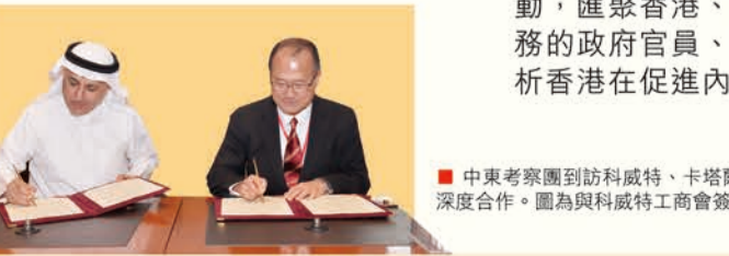
中東考察團到訪科威特、卡塔爾、阿聯酋，推動香港與中東深度合作，圖為與科威特工商會簽訂合作備忘錄。

往來的優勢和作用，為本地工商和全球華商搭建交流平臺。該會亦不忘傳承，培育後起之秀，與香港數碼港合辦「中總世界青年華商交流會」，推動各地青年華商交流合作。中總向來不遺餘力推進香港與海內外工商界加強聯繫合作，推動會員企業做好與內地和海外市場對接工作。該會將陸續組團出訪不同國家，推動香港和內地工商企業加強與東盟、歐盟、「一帶一路」企業合作，同時向外推介香港的產業和服務優勢。此外，該會亦組織海外工商團體、領事等前往大灣區交流，透過親身體驗內地及海外市場發展情況，探索商機，用行動說好中國故事、大灣區故事、香港故事。