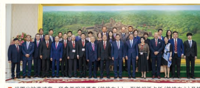
組團出訪柬埔寨，拜會首相洪馬奈（前排右七）、副首相占托（前排右六）及該國11位部長。