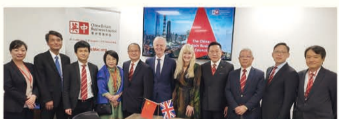
歐洲考察團到訪德國、比利時、法國及英國，進一步拓展香港、內地與歐洲的合作機遇，圖為拜訪英中貿易協會。