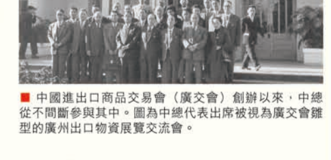
中國進出口商品交易會（廣交會）創辦以來，中總從不間斷參與其中。圖為中總代表出席廣交會期間的廣州出口物貿展覽交流會。