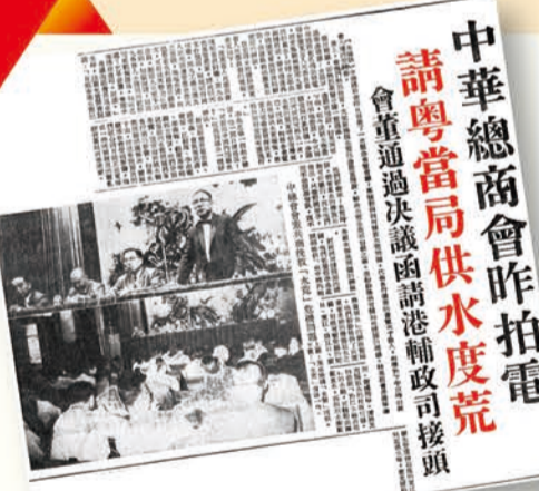
中華總商會昨拍電 請粵當局供水度荒 會電粵省請求港商協助接頭

還在創會伊始，中總已積極投身國家和香港發展建設。新中國成立之際，中總率先在香港升起五星紅旗，彰顯愛國愛港的堅定信念和時代擔當。在國家經濟艱苦歲月的年代，中總扮演連接內地與世界的橋樑。中總從第一屆廣交會開始均組團參加，從不間斷，並協助發放廣交會邀請函，促進國際貿易往來，維繫中外交流，為國家發展注入活力。