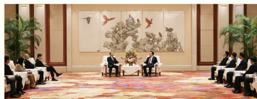
為推動上海、江蘇與粵港大灣區對接，中總組團赴南京及上海考察，期間與江蘇省委書記信長星（正中右）等領導會面交流。