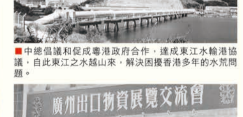
中總倡議和促進粵港政府合作，達成東江水輸港協議，自此東江之水通山來，解決困擾香港多年的水荒問題。