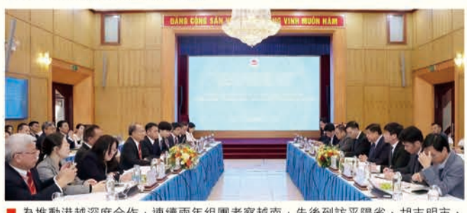
為推動港城深度融合，連續兩年組團考察越南，先後到訪平陽省、胡志明市、海防市及河內。