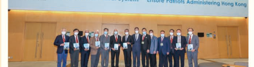
中總全力支持全國人大會議決通過完善香港選舉制度的決定，確保「愛國者治港」得到全面體現和落實，為香港社會和經濟發展構建更穩定根基。圖為中總成員出席由財政司司長主持的相關交流會。