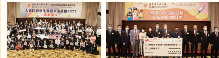
中總每年撥款贊助港大學生前往內地實習，為香港社會和經濟發展構建更穩定根基。圖為中總成員出席由財政司司長主持的相關交流會。