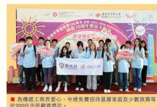
為傳遞工商界愛心，中總免費招待基層家庭及少數族裔等近200位市民觀賞煙花。