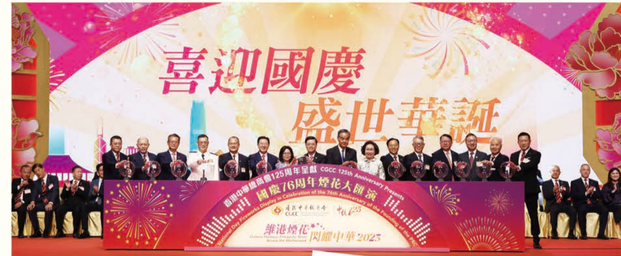
主禮嘉賓與中總一眾首長進行啟動儀式，共同揭開煙花匯演序幕。