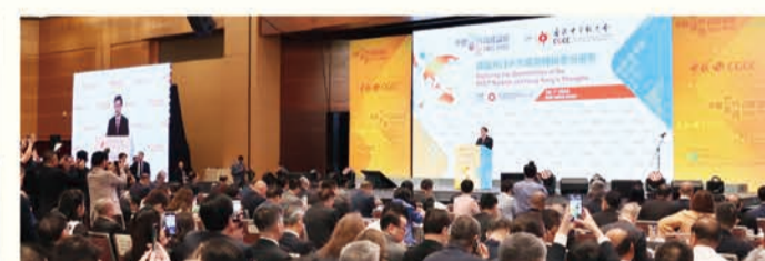
中總去年第三次舉行「中總世界華商高峰論壇」，與本地及RCEP地區一眾精英領袖共同探索區域新機遇。