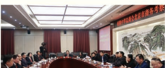
為深化新一輪京港合作，中總組織北京商務考察團，聚精會神聽取京港兩地大商會。