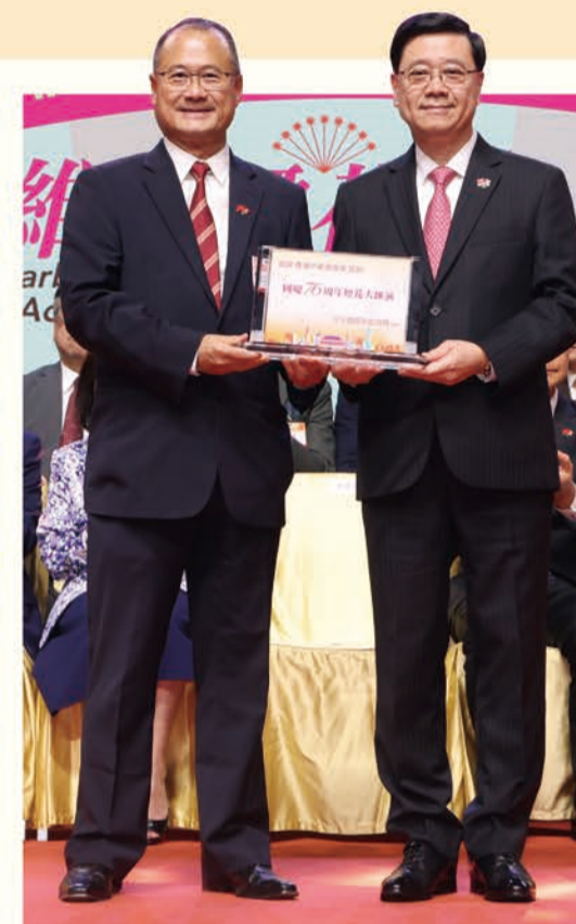
行政長官李家超（右）向中總會長蔡冠深致送紀念品。

用晚餐及觀賞煙花，共同分享國慶喜悅。據警方估計，整個維港兩岸吸引超過34.4萬名觀眾前來觀賞，遠超預期，場面熱鬧非凡。而在現場以外，是次煙花匯演亦獲得廣泛關注。除了傳統印刷媒體及電視台外，逾十家網上媒體亦有所報導或直播。據統計，當晚電視觀看人數逾150萬，而網絡觀看人數