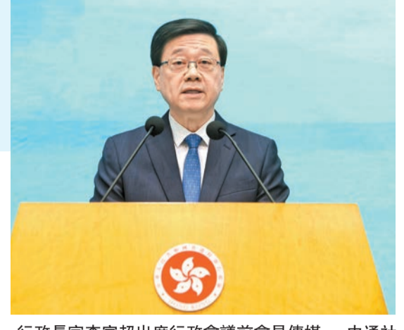
行政長官李家超出席行政會議前會見傳媒。

另外，政務司司長陳國基昨日主持撲滅罪行委員會會議時表示，要建設安全美好的社區，不能單靠政府或單一組織團體的努力，而是需要全民參與，齊心協力。正如即將舉行的立法會選舉，每一票都很重要，他呼籲踴躍投票，履行公民責任，共同打造更安全、更美好的家園。