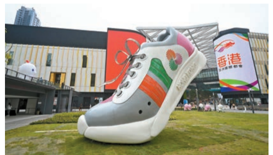
獲獎作品《一步一腳印》，設於啟德車站廣場兩端。