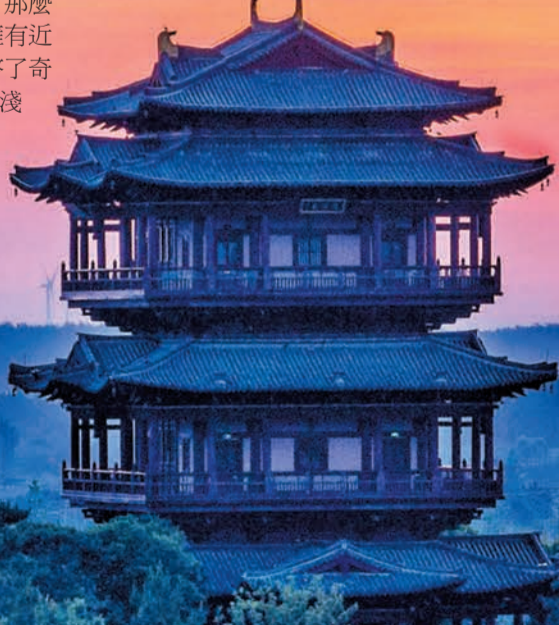
大洋灣生態旅遊景區 登瀛閣

鹽城的秋紅，更延伸至天際線的晨昏交替之間。清晨，在日出海灣看一輪紅日從海平線躍出，瞬間將天空染成絢麗的紅色，景象震撼人心；傍晚，在條子泥濕地觀鳥看潮，追逐落日餘暉，紅色的霞光與灘塗的紅、植被的紅交相融合。這種從地表到天際的全方位紅韻鋪展，讓鹽城的秋天成為「可觀賞、可體驗、可回味」的生態景觀，吸引着各地遊客前來探尋這份獨特的秋日浪漫。