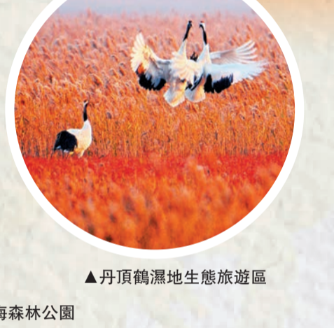
▲丹頂鶴濕地生態旅遊區