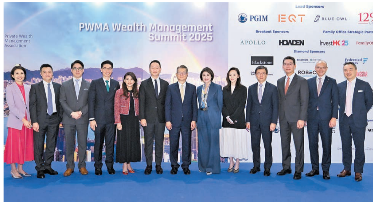
陳茂波（中）出席私人財富管理公會財富管理峰會2025，與其他嘉賓在活動合照。

增長軌道，穩步向前。公會將繼續與業界及政府緊密合作，進一步推廣香港作為「超級聯繫人」及國際財富管理中心的地位。