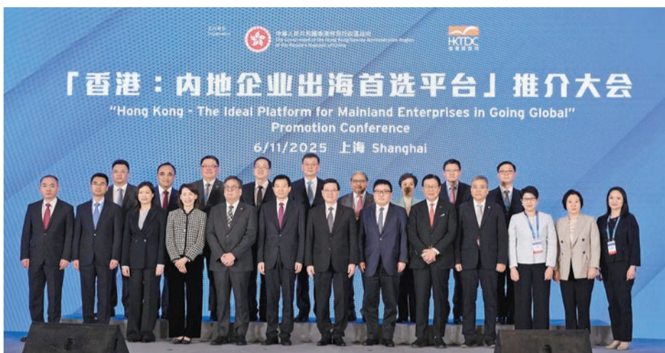
李家超昨日在上海出席「香港：內地企業出海首選平台」推介大會。

上海市委常委、常務副市長吳偉，商務部對外投資和經濟合作司副司長王琦，以及香港貿發局主席馬時亨亦在大會致辭。推介大會邀得多位商界領袖出席和發言，包括馮氏投資主席馮國經，上海實業（集團）有限公司董事長冷偉青，香港科技園公司董事局主席查毅超，中國銀行（香港）有限公司副總裁王化斌，安永中國主席、大中華區首席執行官陳凱，海間律師事務所合夥人劉洋，以及東朝科技發展（上海）有限公司董事長王朝友等。