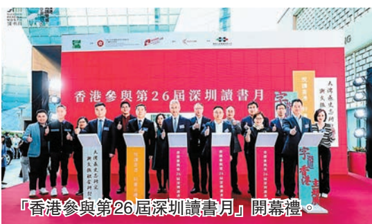
「香港參與第26屆深圳讀書月」開幕禮。

辦近40場精彩活動，涵蓋展覽、市集、分享會、工作坊等多元形式，助營造深厚的深港共讀、共享、共發展的閱讀氛圍。即日起至11月30日還將以「字」為引，開展涵蓋香港街頭書法、香港街道招牌視覺藝術、香港舊城區人文景觀、香港製香傳統與現狀、香港非遺飲食、張愛玲在香港的生活等主題作家分享會，港深城市寫生、香港當鋪夜光招牌製作等主題互動工作坊，邀請深圳乃至粵港澳大灣區的市民與不同領域逾30位專家、作家、藝術家、插畫家交流，深度體驗香港的多元文化魅力。