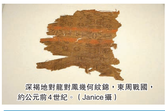
深褐色對龍對鳳幾何紋錦，東周戰國，約公元前4世紀。