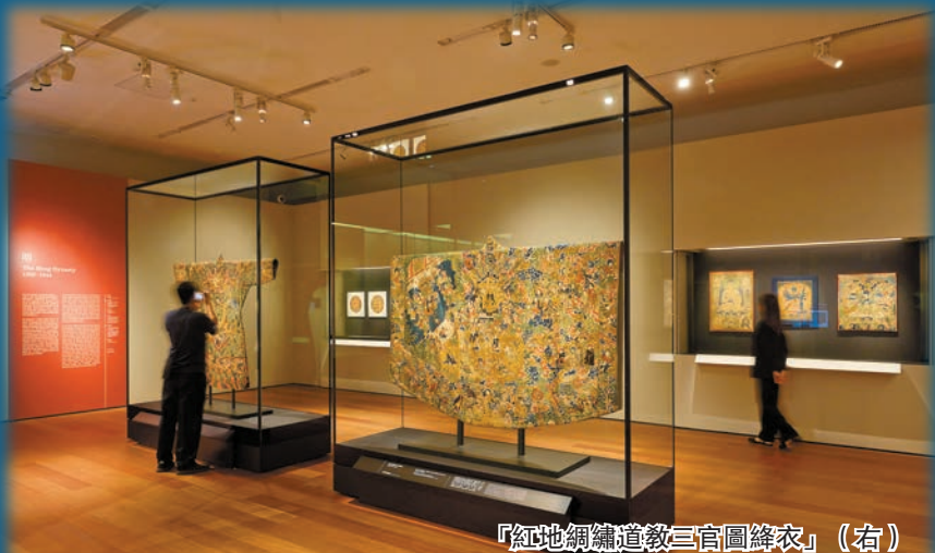
「紅地綢繡道教三官圖絳衣」(右)相當華麗。