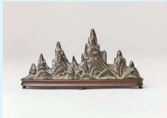
山形筆擱，明末清初，17世紀。