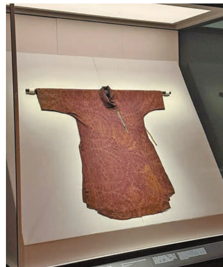
紫綾地大團窠聯珠對獅紋袍，唐，7至8世紀。

在展示象徵明清官階的「補子」展區也設置了電子互動裝置，補子是明清時期織或繡在官服上、飾以飛禽或猛獸紋樣的標識，是官員品級與身份的重要標誌。在展覽中，觀眾不僅通過電子裝置近距離觀賞補子，了解不同紋樣所代表的官階，還可親手觸摸如平針、打籽繡等補子上常用的刺繡繡法。同時，亦可透過互動裝置，以電子形式設計並領取專屬的虛擬補子。這種富趣味性的互動形式，讓人深入認識清代官制與鳥獸紋樣的象徵意義，展現傳統文化與現代科技的創新對話。