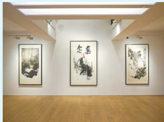
展覽展示了呂壽琨鮮有公開亮相的畫作。