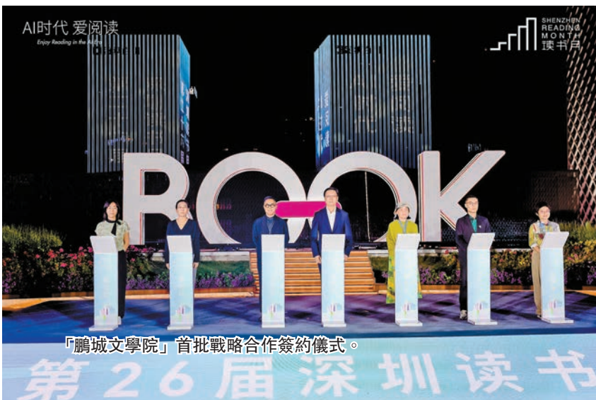
「鵬城文學院」首批戰略合作簽約儀式。

本屆讀書月以「AI時代 愛閱讀」為主題，構建「1+2+10+N」活動矩陣——1個年度聚焦鑰匙核心影響力，2項創新實踐築牢長效根基，10大系列49項重點主理活動搭建立體框架，聯動11區設分會場。