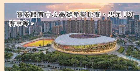
寶安體育中心舉辦拳擊比賽、男足U20賽事等。

與香港一河之隔的深圳寶安，因這場體育盛會而格外火熱。寶安區啟動「灣區聚寶季」文體旅商融合促消費系列活動，從即日起持續至12月，圍繞「巨好看」「巨能玩」「巨划算」三大主線，打造「周周有活動、天天有驚喜」的消費體驗。「灣區聚寶季」特別設計「票根經濟」模式，觀眾憑十五運賽事門票，即可在指定景區、酒店、餐飲商戶享受折扣優惠。