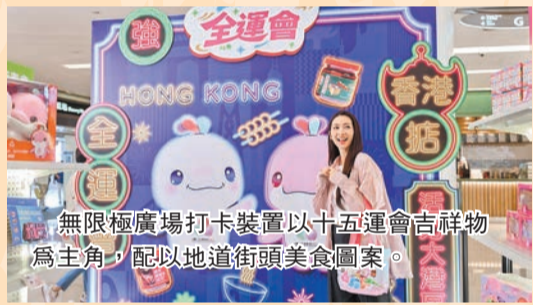
無限極廣場打卡裝置以十五運會吉祥物為主角，配以地道街頭美食圖案。

奧海城商場特設運動主題場館，配備430吋大屏幕和觀眾席，讓市民恍如親臨賽事現場。