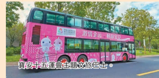
寶安十五運會主題文藝巴士。

寶安區編織覆蓋核心地標的消費網絡，串聯前海冰雪世界、國際會展中心、歡樂港灣、灣區之眼、沙井古墟等標誌性景點，推出「十五運會」特色旅遊線路，實現「觀賽+觀光」的一站式體驗。「浪漫福海河」IP深化打造、「翼躍空港·邂逅會展」系列活動推出，以及海上田園燈光節、前海壹方城史努比限定裝置等主題文創玩法，構成豐富的遊玩行程。