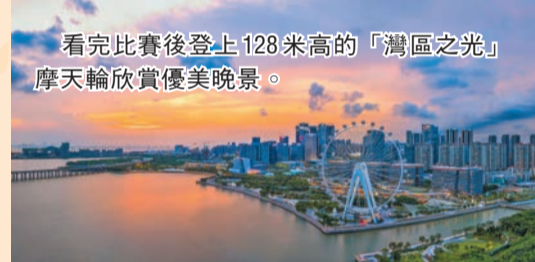
看完比賽後登上128米高的「灣區之光」摩天輪欣賞優美晚景。

一系列文化活動同步展開，濱海演藝中心與海雅大劇院迎來《暗戀桃花源》、俄羅斯芭蕾舞劇《天鵝湖》等經典劇目；「吾城吾歌民謠盛典」「繁星音樂季」等戶外音樂活動。