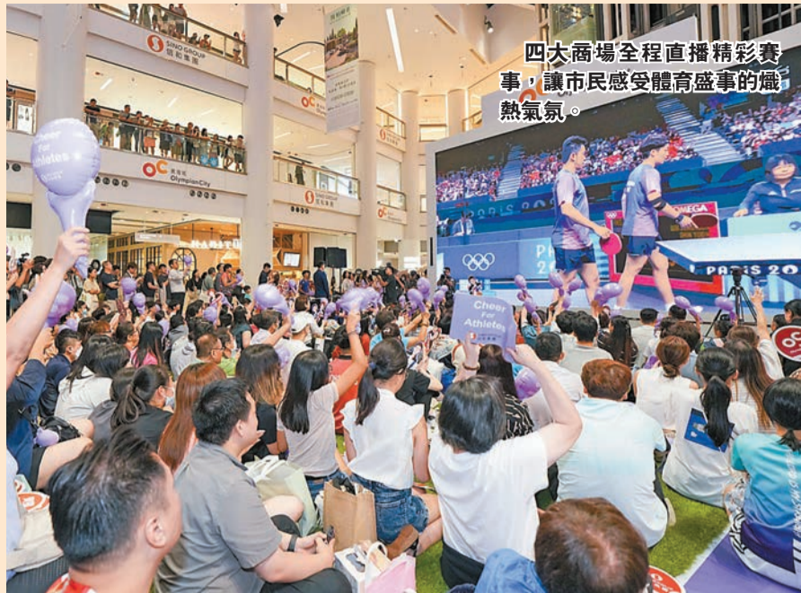
四大商場全程直播精彩賽事，讓市民感受體育盛事的熾熱氣氛。

四年一度的全國運動會是國家最高水平的綜合運動會。香港首次參與承辦這項國家級體育盛事，舉辦籃球、場地自行車、擊劍、高爾夫球、手球、七人制橄欖球、鐵人三項和沙灘排球等八個競賽項目。為迎接這場盛事，香港各界積極響應，其中信和集團旗下四大商場設置大屏幕直播精彩賽事，並舉辦大型打氣會。