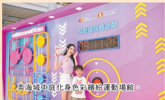
奧海城中庭化身色彩繽紛運動場館。

四年一度的全國運動會是國家最高水平的綜合運動會。香港首次參與承辦這項國家級體育盛事，舉辦籃球、場地自行車、擊劍、高爾夫球、手球、七人制橄欖球、鐵人三項和沙灘排球等八個競賽項目。為迎接這場盛事，香港各界積極響應，其中信和集團旗下四大商場設置大屏幕直播精彩賽事，並舉辦大型打氣會。