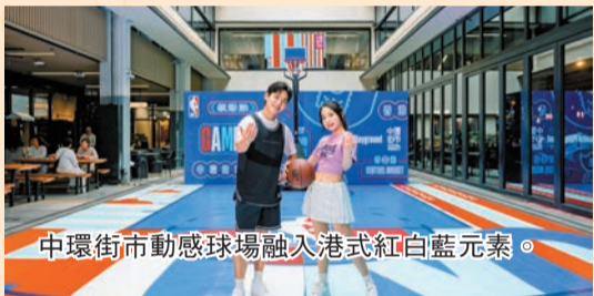
中環街市動感球場融入港式紅白藍元素。

中環街市策劃「Game On! @Central Playground」大型活動，將地下中庭變身為NBA主題港風籃球場，設置「全運挑戰區」鼓勵大眾參與。現場還展出籃球明星簽名紀念品，並設有電競籃球體驗區，讓市民感受運動魅力。