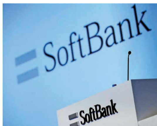
軟銀股價插水，反映AI市場競爭非常激烈。

谷歌母公司Alphabet當地時間24日市值逼近4萬億美元，在人工智能熱潮推動下，有望成為第四家躋身4萬億美元俱樂部的企業。Alphabet股價上漲超過5%，並創下315.9美元的歷史新高，市值達到3.82萬億美元，股價今年已累升近70%，遠遠超過人工智能競爭對手微軟和亞馬遜。