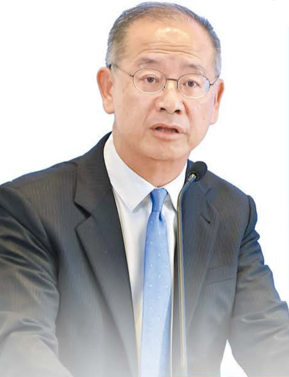
余偉文指，國際機構在區域合作中發揮重要作用。

【香港商報訊】記者姚一鶴報導：昨日，東盟與中日韓經濟合作與金融穩定論壇（AMRO論壇）首度在香港舉行。金管局總裁余偉文致辭時表示，外圍環境儘管愈來愈具挑戰，「ASEAN+3（東盟及中日韓）」經濟增長在面對關稅衝擊下仍保持韌性，區內金融市場在近期全球波動中亦處於穩定，貨幣大部分時間維持平穩。他又認為，需在貿易數字化、支付一體化、金融安全網等方面深化區域合作，加快提升跨境貿易效率。