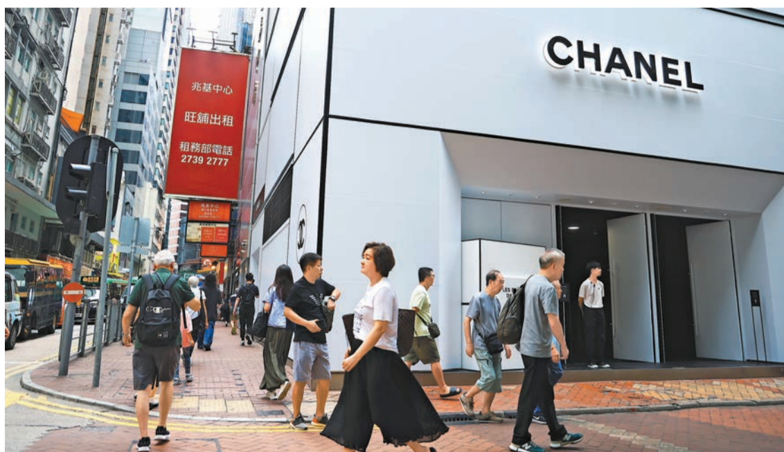
中原工商舖數據顯示，11月工商舖錄得327宗買賣成交，按月升近24%。資料圖片

成交，按月及按年分別回升約38.64%及約3.39%；涉及金額約9.11億元，按月增加約12.39%，按年則回落約29.85%。