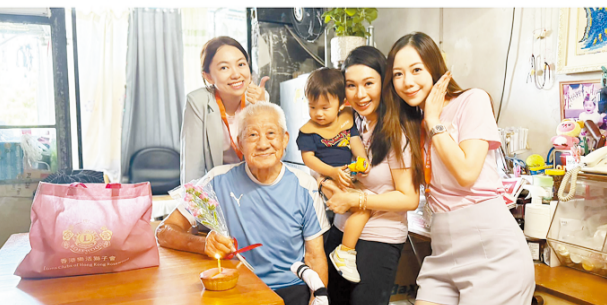
(上圖) 國際獅子總會中國港澳303區香港樂活獅子會舉辦「攀石童樂日」，支持基層小朋友挑戰自我，向目標進發；同時定期探訪獨居老人，送上社會溫暖(下圖)。