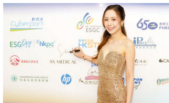
AS MEDICAL 榮獲《卓越醫學美容中心》，開創高級個人化定製醫美先河。

厲害。她熱愛從商，因為她覺得做生意和做人一樣，唯有不斷勇敢披荊斬棘挑戰自我，才會越戰越勇。