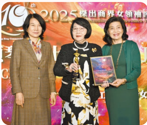
全國人大代表、全國婦聯執委、珠海格力電器股份有限公司董事長董明珠(左)與大中華文化全球協會創會主席趙曾學韜(右)頒獎予蔡關穎琴。

感謝我的丈夫和家人給我空間及時間，讓我能積極參與社會事務，服務社會和市民。感謝香港特區多個委員會(包括法律改革委員會、基本法推廣督導委員會、公民教育委員會)、婦女界(包括全國及天津市婦聯、香港天津工商專業婦女委員會、香港各界婦女聯合協進會、香港女律師協會、香港女董事總會)及文化界(包括香港管弦樂團、香港歌劇院、誼樂社)等，給予了我很多學習和發揮的機會。未來我將繼續與社會各界攜手並肩，爲中華民族復興、祖國強大、香港繁榮安定盡最大的努力，作出貢獻。