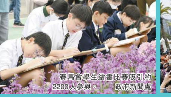
賽馬會學生繪畫比賽吸引約 2200 人參與。

杜淦堃表示，火警警報系統在多個環節出現不幸及人為過失，獨立委員會希望盡快探討相關情況，包括承辦商沒有妥善評估停用消防設備的需要、物業管理公司關閉消防系統關閉、承辦商沒有加強監管及加快工程進度、火警當天是否及時啟動裝置等。 另一方面，就聽證會披露有關工人吸煙的問題，勞工處會先後 16 次巡查，均未見到工人在棚架上吸煙。勞工及福利局局長孫玉菡昨日出席公開活動後表示，勞工處與其他政府部門一樣，都會全力配合委員會的調查工作，做好資料提供及參與聆訊。他又說，正全速進行地盤全面禁煙的修例工作，本月底勞工處會出席立法會相關事務委員會會議，詳細解釋如何落實地盤全面禁煙，目標是爭取上半年內，將附屬法例提交立法會審議，以便可以盡快落實。