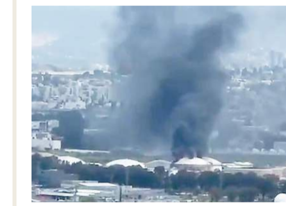
以色列海法煉油廠遇襲，濃煙升上半空。

西班牙政府昨天宣布，禁止參與伊朗戰事的美國及以色列軍機進入該國領空。禁令同時涵蓋美軍部署在英國及法國等第三國的軍機。