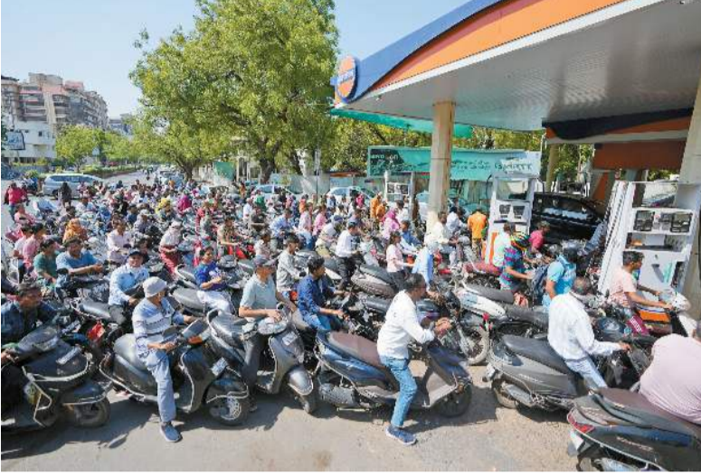
印度汽油價格近日大幅上升，司機大排長龍等待加油。

【香港商報訊】記者郭志文報導：中東戰火持續升級，隨著霍爾木茲海峽持續封鎖，油氣供應鏈將出現由淺入深的連鎖反應，呈現一段一段斷裂。專家指出，一旦關鍵節點失靈，對於供應鏈的衝擊，將逐步傳導並形成骨牌效應，將對商品價格體系、經濟增長路徑及全球能源格局產生長遠影響。